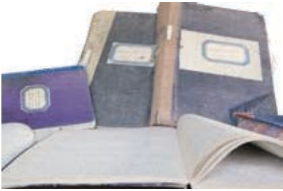
Πρακτικά του Δήμου Λεμεσού από το 1878