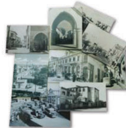
Πλούσιο το Φωτογραφικό Αρχείο του Δήμου Λεμεσού

Το Αρχείο του Δήμου Λεμεσού προέκυψε από προφορικές και γραπτές πηγές, φωτογραφίες, «εφήμερα» και αντικείμενα που όλα περιγράφουν με τον καλύτερο τρόπο την ιστορική εξέλιξη της πόλης. Ταυτόχρονα, ένας μεγάλος αριθμός εθελοντών, που αποτελεί τη σπονδυλική στήλη του Αρχείου, εκπαιδεύεται στην ιστορική έρευνα, την αρχειονομία κ.λπ. Μέχρι σήμερα τα μέλη του έχουν παρουσιάσει εργασίες σχετικά με την ιστορία της Λεμεσού, στην Κύπρο και το εξωτερικό. Μέλη του Αρχείου προσκαλούνται και επισκέπτονται σε τακτική βάση σχολεία και διάφορα άλλα ιδρύματα όπου παρουσιάζουν εργασίες σχετικές