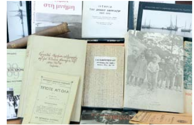
Από τη συλλογή παλαιών βιβλίων του Δήμου Λεμεσού

με την ιστορία της πόλης και βοηθούν, παράλληλα, εκπαιδευτικούς και μαθητές στη διεξαγωγή εργασιών που έχουν σχέση με την ιστορία της Λεμεσού.