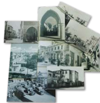
Πλούσιο το Φωτογραφικό Αρχείο του Δήμου Λεμεσού

Το Αρχείο του Δήμου Λεμεσού προέκυψε από προφορικές και γραπτές πηγές, φωτογραφίες, «εφήμερα» και αντικείμενα που όλα περιγράφουν με τον καλύτερο τρόπο την ιστορική εξέλιξη της πόλης. Ταυτόχρονα, ένας μεγάλος αριθμός εθελοντών, που αποτελεί τη σπονδυλική στήλη του Αρχείου, εκπαιδεύεται στην ιστορική έρευνα, την αρχειονομία κ.λπ. Μέχρι σήμερα τα μέλη του έχουν παρουσιάσει εργασίες σχετικά με την ιστορία της Λεμεσού, στην Κύπρο και το εξωτερικό. Μέλη του Αρχείου προσκαλούνται και επισκέπτονται σε τακτική βάση σχολεία και διάφορα άλλα ιδρύματα όπου παρουσιάζουν εργασίες σχετικές