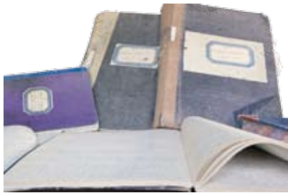
Πρακτικά του Δήμου Λεμεσού από το 1878