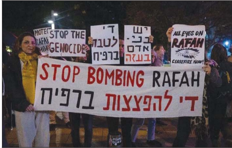
Διαμαρτυρία του Δικτύου Αντιρρησιών Συνείδησης Mesarvot (Αρνούμαστε) στο Τελ Αβίβ, 15 Φεβρουαρίου 2024.

γενοκτονίες, αυτό είναι μέρος του. Οι γενοκτονίες δεν διαπράττονται μόνο από μια ομάδα εξτρεμιστών που ευχαριστούνται να πυροβολούν, αλλά από τις μάζες που συσπειρώνονται πίσω από πολιτικούς και κενά συνθήματα. Από ανθρώπους που δίνουν διαφορετική σημασία στο θάνατο και τη δολοφονία. Για αυτούς δεν είναι 15 χιλιάδες νεκρά παιδιά, είναι «αυτό που πρέπει να γίνει». Οι περαστικοί που σκίζουν τις εικόνες των μητέρων που κλαίνε πάνω από τα νεκρά παιδιά τους το κάνουν γιατί δεν μπορούν να αντιμετωπίσουν την εικόνα τους στον καθρέφτη. Είναι πολύ άσχημη, κι έτσι προτιμούν να αρνηθούν την ευθύνη τους, προτιμούν να την κρύψουν από τις ειδήσεις.