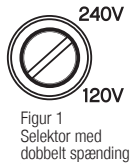
Figur 1 Selektor med dobbelt spænding

Din ghd flighter udstyret med en dobbeltspændingsvælger (fig. 1). For at anvende denne funktion; indsæt en mønt for at skifte gh flight for at vælge den krævede indgående spænding, dvs. 120V eller 240V.