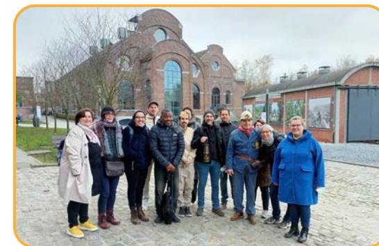
Photographie de la visite guidée du groupe BAGIC Charleroi au Bois-du-Cazier, coll. CARHOP.

visites des lieux emblématiques de combats sociaux et des expositions sont organisées afin d'ouvrir la réflexion sur les enjeux de l'histoire sociale, le récit de vie-outil relève toute l'importance de la mémoire orale, les étudiant.e.s sont invités à analyser et décortiquer les sources d'archives, etc.