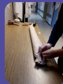
Reconditionnement des drapeaux lors du chantier mené par l'équipe.