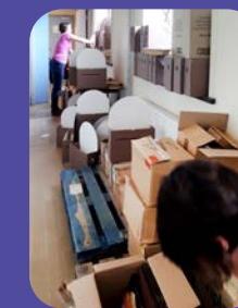
Archive issue du fonds JOC, reconditionnée dans le cadre du chantier.