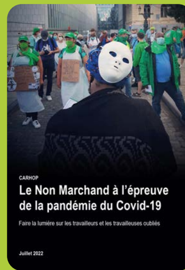
CARHOP, Le Non Marchand à l'épreuve du Covid-19. Faire la lumière sur les travailleurs et travailleuses oubliés , Bruxelles, juillet 2022.

Cet ouvrage est le résultat de rencontres avec des groupes de travailleuses et travailleurs des secteurs du Non Marchand (à l'exception du personnel des milieux hospitaliers), en première ligne lors de la lutte contre la pandémie. Occupés dans l'aide et soins à domicile, les maisons de repos, l'aide aux personnes handicapées, l'aide à la jeunesse, l'accueil de l'enfance, l'insertion socio-professionnelle, etc. toutes et tous ont vécu de l'intérieur les drames humains endurés aussi bien par les collègues que les usagers. Les témoignages recueillis sont édifiants. En voici quelques extraits :