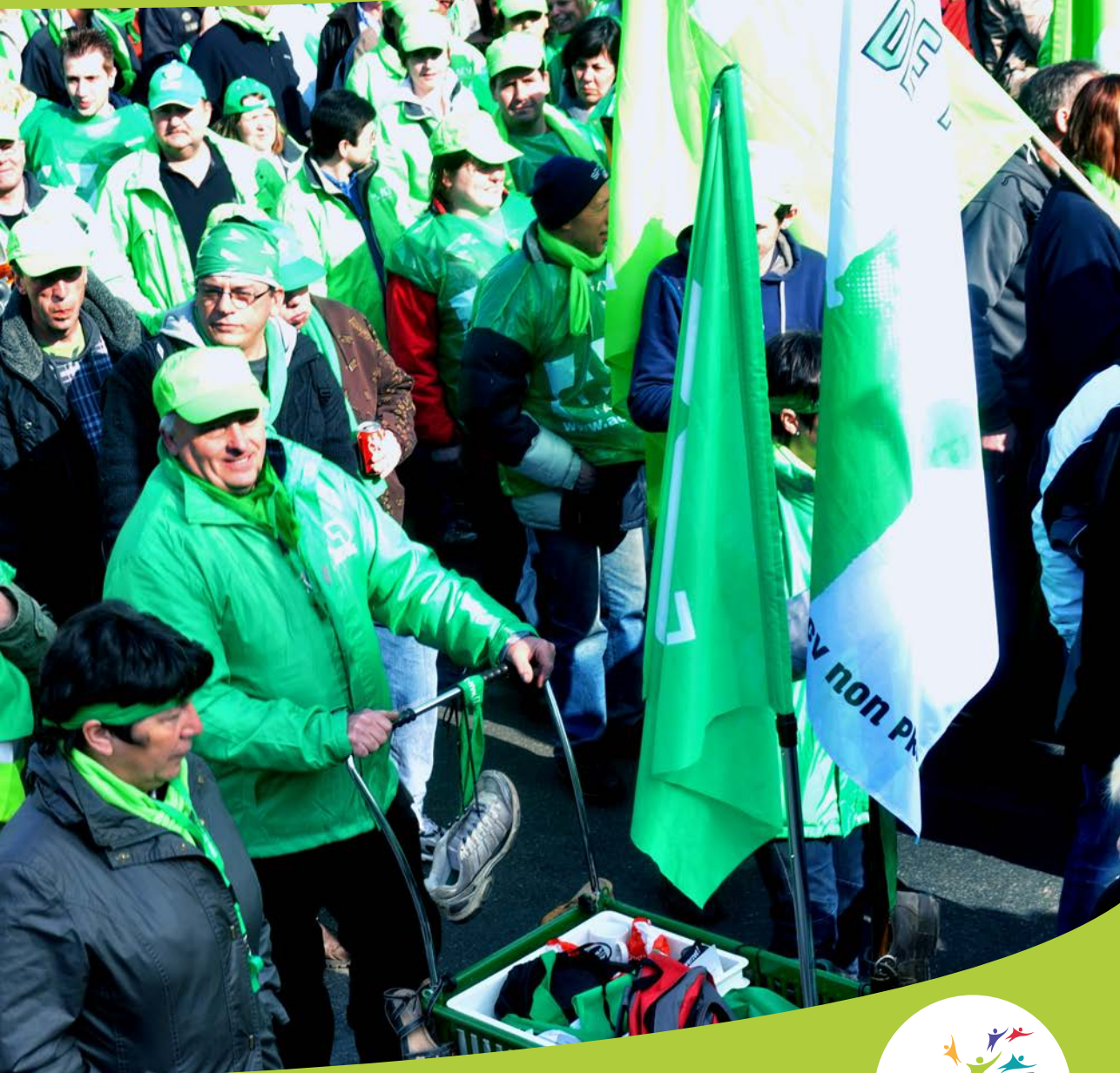
Manifestation nationale du non marchand, Bruxelles, 2011.