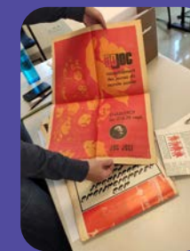
Tri et reconditionnement dans le cadre du chantier "JOC".