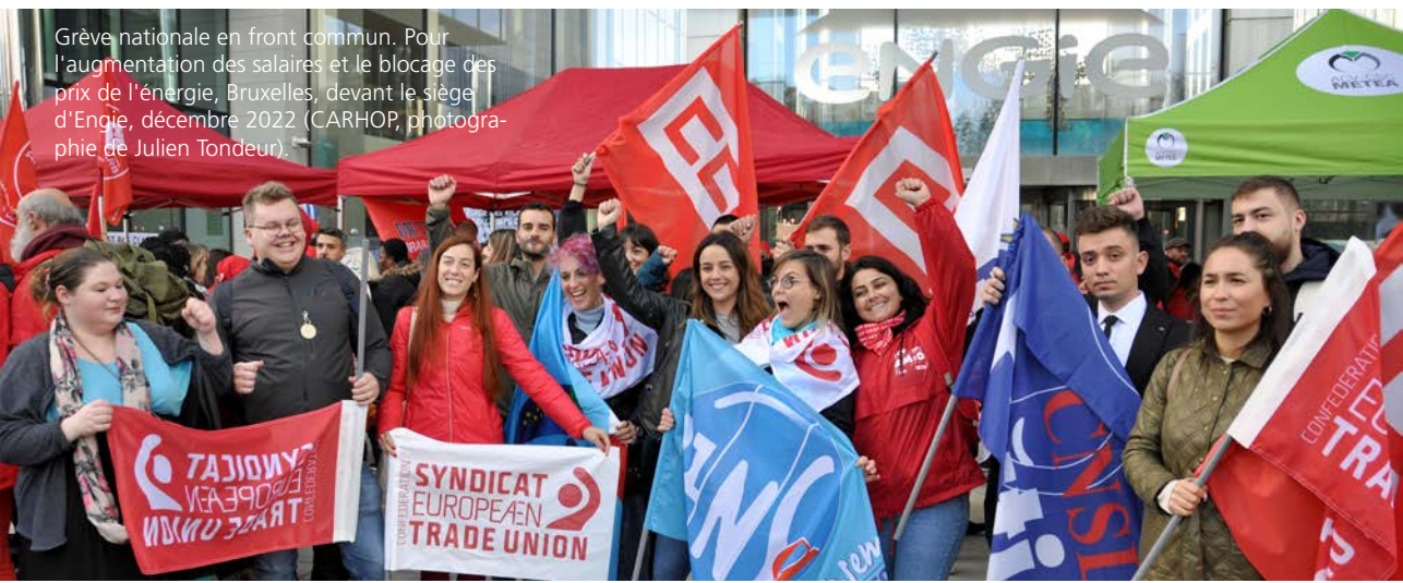
Grève nationale en front commun. Pour l'augmentation des salaires et le blocage des prix de l'énergie, Bruxelles, devant le siège d'Engie, décembre 2022.

Action Vivre Ensemble. Les mythes du travail, 1970 (CARHOP, coll. aff., n° 257).