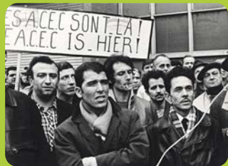
CARHOP, série photos, Revue Dynamiques n° 18, IHOES, 2021.