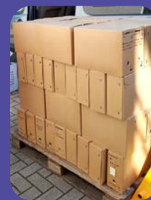
Arrivée des archives du MOC Huy-Waremme.

En octobre, l'équipe a travaillé sur la collection de drapeaux. Chaque pièce a été mesurée, photographiée, décrite et emballée soigneusement afin de lui assurer des conditions de conservation optimale et une valorisation (d'ici quelques semaines) au travers d'une exposition sur la base de données du CARHOP. En novembre et décembre, ce sont les archives entreposées dans un local de transit depuis quelques temps qui ont fait l'objet d'un tri et d'un reconditionnement. Ce travail permet de mieux appréhender le contenu des fonds et de faciliter le lancement des inventaires.