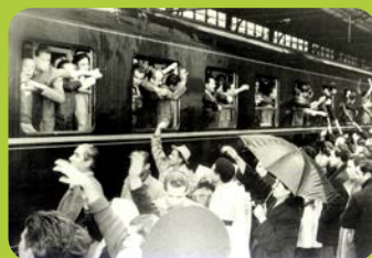
CARHOP, série photos, Revue Dynamiques n° 19, s.l., 2021.

« Les luttes antiracistes en Belgique... Encore et toujours... ». Dans la foulée de la campagne annuelle 2021 menée par le CIEP et intitulée « Raciste malgré moi. Ensemble, déconstruisons le racisme structurel ! », ce numéro de Dynamiques vous invite à vous plonger dans les dispositifs élaborés par les mouvements sociaux et le monde politique, à partir des années 1970, pour combattre le racisme et, plus largement, l'extrême-droite.