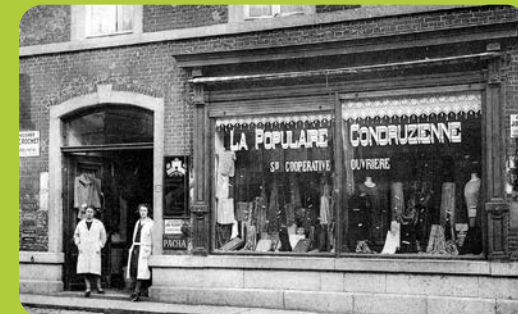
CARHOP, série photos, Revue Dynamiques n° 20, s.l., 2021.

Par son histoire longue de près de 150 ans, l'économie sociale connaît des évolutions notables et est animée d'enjeux et de tensions qui fluctuent avec le temps. Du fait que le mouvement ouvrier soit le principal initiateur de l'économie sociale, ce numéro de Dynamiques ne peut faire l'économie d'un regard rétrospectif sur la longue durée.