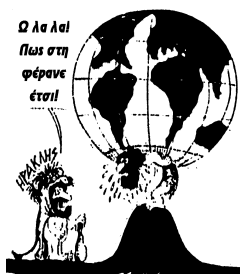
Ο λαός μας στη φετινή άνοιξη