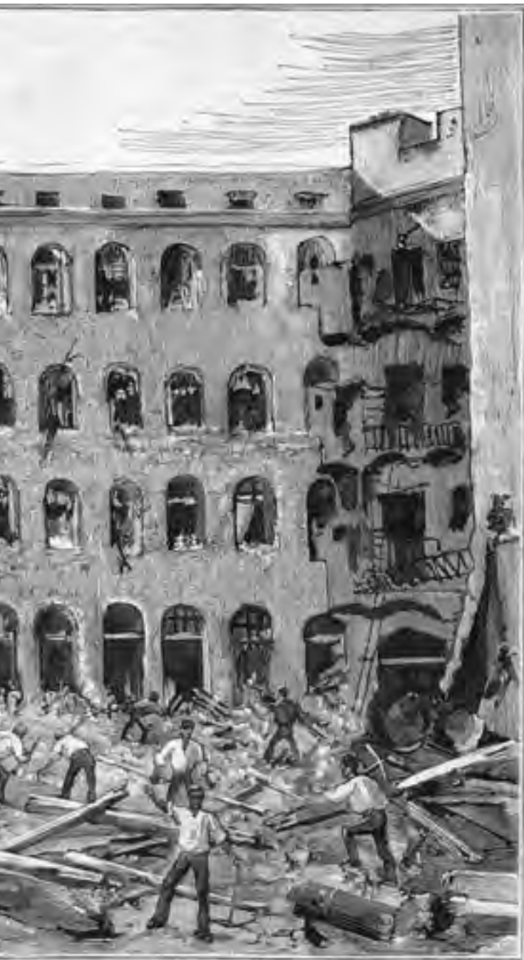
Explosió de la caldera de vapor de la fàbrica «Morell y Murillo», situada al carrer Reina Amàlia, n. 14. El desastre esdevingué el dia 26 de juny de 1882, morint 20 persones entre dones, criatures i homes; la desgràcia ocorregué per la cobdícia i el menyspreu dels amos vers els treballadors en fer treballar la caldera molt pel damunt de les seves possibilitats tècniques. (Dibuix d'Antoni Rigalt Blanch)