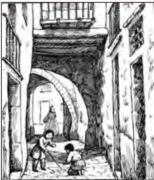
Nens jugant al carrer (dibuix de Lola Anglada)

El 1862 i a la mateixa fàbrica, el salari de les dones oscil·lava entre un 55 i un 57% menys respecte al dels homes. Quan a mitjans del segle la patronal va aconseguir que la major part de la producció seria a preu