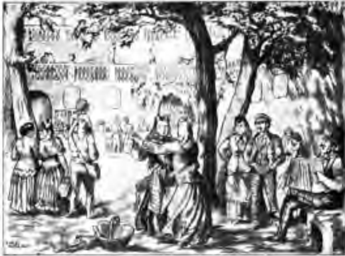
Un diumenge a la popular Font del Gat , a Montjuïc (dibuix de Lola Anglada)

També alguns, sobretot homes, estan agrupats en les associacions corals que Anselm Clavé havia creat al voltant dels anys cinquanta.