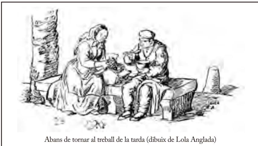
Abans de tornar al treball de la tarda (dibuix de Lola Anglada)

Com no podia ser d'altra manera, la patronal va encapçalar diverses subscripcions pels afectats; els benestants socis del «Casino Mercantil» van destinar 800 duros per al socors de les víctimes, sense oblidar-se, però, de deixar-ne 200 per al monument a Cristòfol Colom.