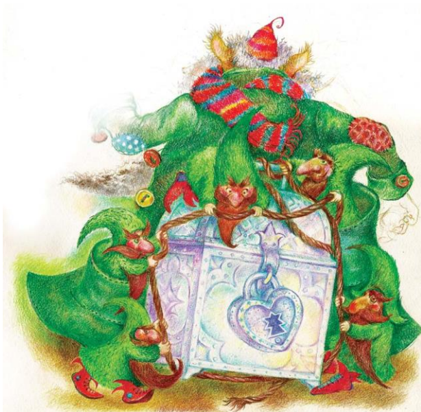
мал. О. Турської

Величезна завірюха тоді утворюється. Привести до ладу цю завірюху Сніжинці допомагає Сніговий Слон. Він щосили дмухає своїм хоботом, і сніжинки, підхоплені Вітром, розлітаються по всій землі. Так триває усю зиму. Щодня фея дістає із крижаної скрині нову шубку й струшує її. І так рік у рік, відтоді, як заселили феї та чарівники Землю. Проте якось одного року трапилася дуже прикра історія, коли Зима могла б назавжди втратити сніг. А було це ось як.