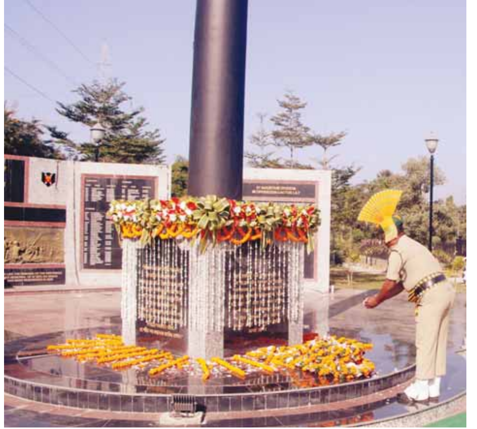
अगरतला में 1971 के युद्ध के 50 साल पूरे होने पर मनाया विजय दिवस।

नई दिल्ली | विश्व हिंदू परिषद (विहिप) ने बृहस्पतिवार को मांग उठाई कि सरकार भारत में तबलीगी जमात पर पूर्ण प्रतिबंध लगाए। साथ ही विहिप ने दारुल उलूम देवबंद और पांपुलर फ्रंट ऑफ इंडिया (पीएफआई) पर निशाने साधते हुए आरोप लगाया कि ए तबलीगी जमात को प्रत्यक्ष या अप्रत्यक्ष तौर से मदद पहुंचाते हैं। विहिप ने एक बयान में यह भी मांग की कि दिल्ली स्थित निजामुद्दीन मरकज इमारत और तबलीगी जमात के बैंक खातों को सील किया जाए और इसके आर्थिक जरूरतों और संसाधनों के बारे में पता लगाया जाना चाहिए। विहिप ने आरोप लगाया, ना केवल भारत बल्कि पूरी दुनिया तबलीगी जमात और इसके निजामुद्दीन मरकज के गैर-कानूनी कर्मों के कारण आज गंभीर परेशानी में है। बयान में मांग की गई कि भारत में तबलीगीयों, तबलीगी जमात और इज्तिमा (धार्मिक जुटन) पर पूरी तरह प्रतिबंध लगाया जाए। सऊदी अरब ने तबलीगी जमात और अल-अहबाब को समाज के लिए खतरा और आतंकवाद का द्वार करार देते हुए इन संगठनों पर प्रतिबंध लगा दिया था।