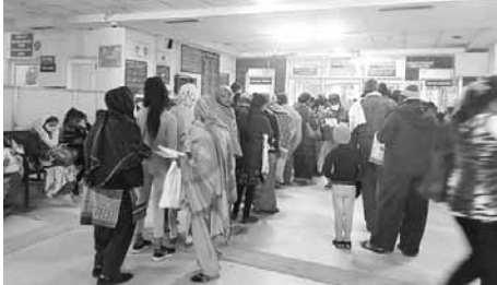
ओपीडी के कार्ड रिन्यू काउंटर पर लगी भीड़।

बादशाह खान सिविल अस्पताल में मरीज यहाँ से वहाँ चक्कर काटने को मजबूर हो रहे हैं। यहां भर्ती होने के बाद दोबारा इलाज को आ रहे मरीजों के कार्ड ही नहीं बन पा रहे हैं। कार्ड काउंटर पर कर्मचारियों की संख्या कम होने से मरीजों को घंटों लाइन में खड़ा रहना पड़ रहा है। जिससे अस्पताल की ओपीडी खाली होती है और पंजीकरण व कार्ड रिन्यू कार्डों पर भारी भीड़ रहती है। सिविल अस्पताल में ऑनलाइन