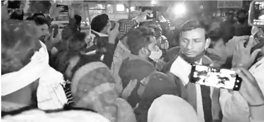
बीके अस्पताल की मोरचरी पर हंगामा करते मृतक के परिजन।

थाना डबुआ इलाके से चार दिन पूर्व हस्तगत हालत में लापता हुए 14 वर्षीय किशोर का शव पुलिस ने सूरजकुंड की पहाड़ियों पर स्थित एक मैरिज गार्डन के पीछे झाड़ियों से बगामद किया है। इलाके में कचौड़ी की रेहड़ी लगाने वाले एक व्यक्ति ने अपने साथी अंटो चालक के साथ मिलकर इस वारदात को अंजाम दिया है। पुलिस ने अंटो चालक को गिरफ्तार कर लिया है। परिजनों ने पुलिस पर लापता बच्चे की तलाश में लापरवाही बरतने का आरोप लगाते हुए जमकर हंगामा किया।