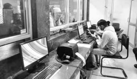
एक ही ऑपरेटर के हवाले सेकड़ों मरीजों के कार्ड।

सिस्टम लागू होने के बाद जब तक अस्पताल से डिसचार्ज मरीज की फाइल कम्प्यूटर पर नहीं चढ़ती, तब तक मरीज आधार कार्ड या फोन नम्बर से दूसरा कार्ड नहीं बनवा सकता। वहीं मरीज को भर्ती करते समय पुनः ओपीडी कार्ड के नम्बर के आधार पर ही भर्ती किया जाता है। वह मरीज जब दोबारा इलाज को आते हैं तो मरीजों को कहा जाता है