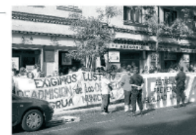
Una manifestación durante una de las jornadas de los trabajadores de Sevilla durante el conflicto del CPT en Sevilla.

Con el apoyo de la CGT, la Mancomunidad de Sevilla y el sindicato de la UGT, el comité de huelga del CPT Sevilla se ha declarado vencedor en su lucha por la recuperación de los salarios y condiciones de trabajo. Los trabajadores han conseguido la mayoría de sus objetivos y se han pasado de huelga indefinida a huelga limitada.