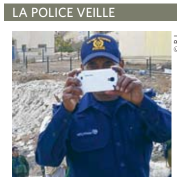
LA POLICE VEILLE