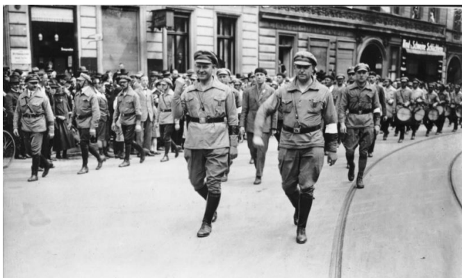
РОТ-фронт. Берлин. 1927 г.