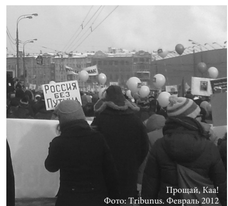
Прощай, Каа! Февраль 2012