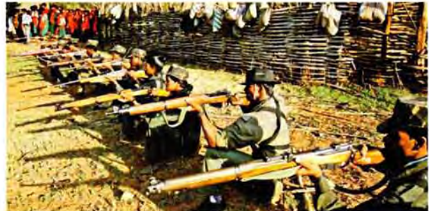
Training der PLA

Daher ist das generelle Prinzip der urbanen Organisationsformen, dass die Massenorganisationen so breit wie möglich sein sollten. Da die indische politische Situation uneinheitlich ist, müssen wir die richtige Kombination verschiedener Typen von Massenorganisationen erforschen. Während in AP 3 keine Möglichkeit besteht, offene revolutionäre Massenorganisationen zu gründen, gibt es in einigen Staaten diese Möglichkeit immer noch.