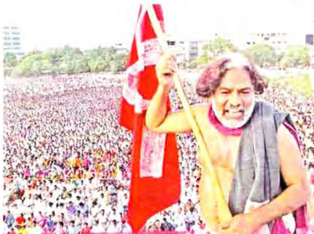
Massenversammlung in Gaddar

Kampfanglegenheiten sind gewöhnlich ein Kennzeichen lokaler Arbeit in den armen Gegenden, insbesondere in den Slums. Kämpfe für die Grundversorgung wie Wasser, Elektrizität, Toiletten oder Kanalisation, gegen Korruption oder Ausbeutung durch Besitzer von kleinen Lebensmittelläden, Panschern und Schwarzhändlern, gegen Slumlords, Goonda-Gangs und anderen Lumpen 7 , und gegen die Zerstörung sind einige der gewöhnlichen Angelegenheiten.