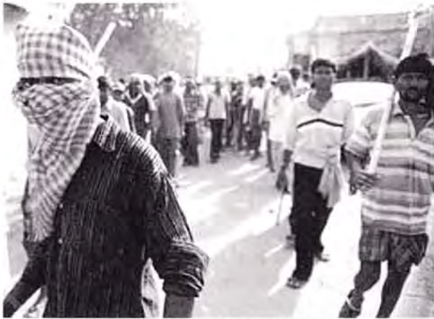
Proteste in Lalgah gegen die Errichtung einer Sonderwirtschaftszone

Vereinte Gewerkschaften sind wichtig, um die Kampfmacht der Arbeiter/innenklasse zu stärken. Die Einheitsfronten mögen problembezogen sein oder auf einem minimalen politischen Verständnis und Programm basieren. Sie können auf verschiedenen Ebenen organisiert werden – je nach Industrie, Gebiet, Stadt, Region, gesamtindisch und international.