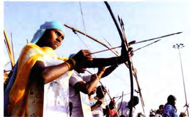
Der Protest in Lalgarg kennt viele verschiedene Waffen

Bestimmte Unterstützungsgüter oder Kontakte für solche sind nur in den urbanen Gebieten erhältlich. Beispiele dafür sind Waffen und Munition, Ersatzteile, gewisse medizinische Hilfsmittel usw. Diesbezüglich ist die urbane Organisation in der Lage, der Volksarmee zu helfen, Nachschublinien in Stand zu setzen. Ist eine solche Nachschublinie einmal aufgebaut, so wird sie dennoch am besten von der ländlichen Organisation unterhalten. Mit dem Wachsen der Erfordernisse der Stützpunktgebiete und der Guerillazonen wird es sogar nötig, deswegen einen separaten Nachschub- und Transportflügel aufzubauen.