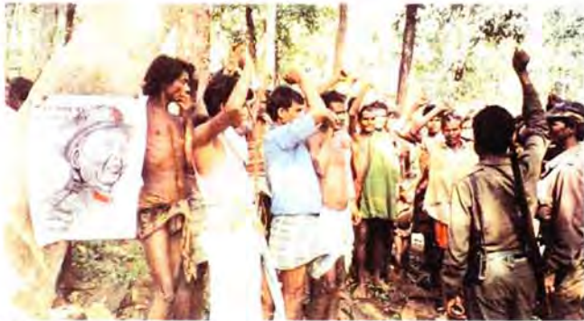
Versammlung im Dorf mit Adivasi und Maoist/innen

Die Arbeit, die Arbeiter-Bauern-Allianz aufzubauen und zu unterstützen, sollte in allen Gebieten unserer Arbeit in der Arbeiter/innenklasse aufgenommen werden. So soll in den Metropolen, welche von den ländlichen Gebieten und dem landwirtschaftlichen Kampf mehr oder weniger abgeschnitten sind, der Hauptfokus auf der kontinuierlichen Bildung und Propaganda liegen, um das Bewusstsein der Arbeiter/innen zu stärken. In den Städten in und nahe den Guerilla-Zonen, wo die Massen der Arbeiter/innen und Bäuer/innen eng verknüpft sind, kann der Fokus auf konkrete Fragestellungen und praktische Hilfe für die Bewegungen liegen. Verschiedene Organisationen spielen hier verschiedene Rollen.