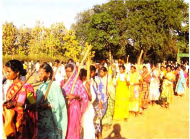
Lalgarh: Frauen protestieren gegen die Einrichtung einer Sonderwirtschaftszone

ist, stärkt es die legale Organisation in hohem Maße, gibt den einfachen Mitgliedern und der lokalen Führung Vertrauen und setzt die kreativen Energien der Massen frei. Wenn diese Art Aktivität in einem Gebiet wächst, gewinnen neue, kreative Formen des militanten Kampfes der Massen Auftrieb. Gleichzeitig demoralisiert und lähmt es den Gegner und hält ihn davon ab, seine alten Repressionsformen anzuwenden.