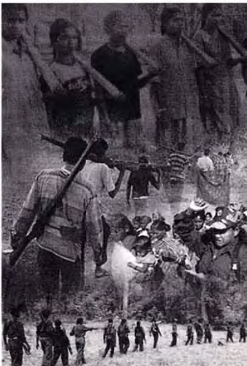
Collage: Symbiotische Beziehung zwischen Adivasi und Maoist/innen

treffen können. Dies ist in den städtischen Gebieten besonders wichtig, da es dort sehr schwierig ist, ständig engen Kontakt aufrecht zu erhalten zwischen den höheren geheimen Strukturen und den niedrigeren Strukturen die offen arbeiten. Es ist auch wichtig, da städtische Arbeit häufig schnelle Reaktionen erfordert auf Ereignisse, die gerade geschehen. Mit dem schnellen Fortschritt der elektronischen Kommunikation und der Medien kann eine Verzögerung unserer Antwort von Tagen, ja manchmal sogar Stunden auf grössere Ereignisse den Effekt stark einschränken, die unsere Partei auf die Bewegungen in den Städten hat. Daher hängt dies von der Stärke der Strukturen ab, die die Basis der Partei in den Städten bilden, den Zellen und den niederen Komitees, sowie den Fraktionen, welche die Verbindung zwischen Partei und Massenorganisationen schaffen.