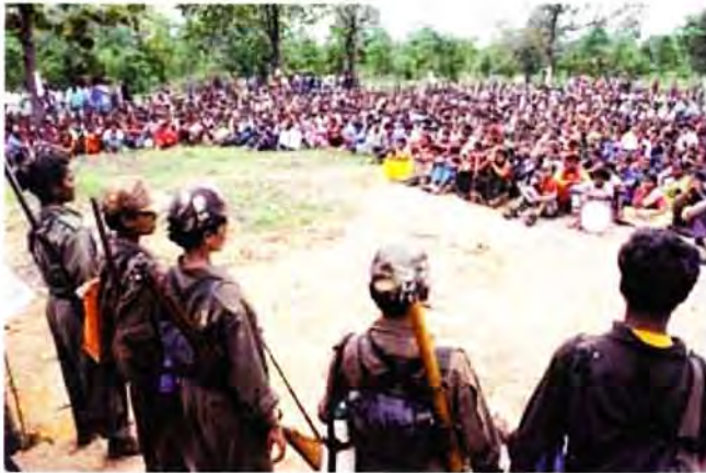
Kämpferinnen der PLGA und Adivasis in einer Versammlung

Wo möglich, sollten Allianzen gegen den gegenwärtigen reaktionären Trend der urbanen Entwicklung aufgestellt werden, in welchen die Slumbewohner/innen, die Strassenhändler-Organisationen, Gewerkschaften und auch Gruppen der progressiven oberen Klasse und Intellektuellen teilnehmen. Während diese Allianzen einerseits alle direkt betroffenen Klassen vereinen sollen, sollten sie auch darauf zielen, die mittleren Klassen zu bilden, da diese oft durch die 'Sauber-und-grün'-Propaganda der herrschenden Klassen überzeugt werden. Es sollte auch das Ziel sein, eine breite Einheit aller ausgebeuteten Teile gegen die Programme der Globalisierer, welche gegen das Volk gerichtet sind, aufzubauen.