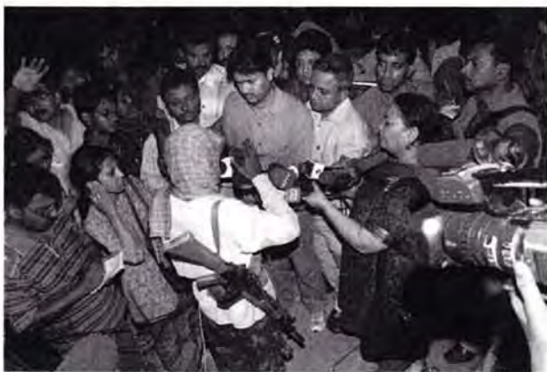
Maoist/innen sind gefragte Interviewpartner/innen

Urbane Massengewalt auf Grundlage der Nationalität ist verhältnismässig selten. Beispiele sind die Cauvery-Krawalle in Bangalore, wo tamilische nationale Minderheiten angegriffen wurden oder 1967 Mumbai, wo durch Shiv Sena Nationalchauvinisten Südindier angegriffen. Dies fand in hohem Masse aufgrund der fehlenden Unterstützung durch integrierende herrschende Klassen in ganz Indien und des zentralen Staatsapparates statt.