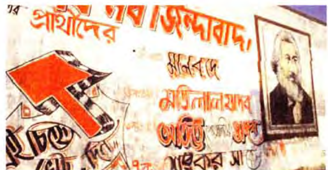
Wandmalerei in Kalkutta

Delhi behält weiterhin seine gesamtindische Wichtigkeit, hauptsächlich als administrative Hauptstadt und auch wegen der schnellen Industrialisierung seiner umliegenden Gebiete. Mumbai als Finanzhauptstadt wächst kontinuierlich schnell und ist jetzt unter den fünf grössten Städte der Welt. Kalkutta und Chennai behält weiterhin seine regionale Bedeutung, aber Kalkutta hat seine gesamtindische Bedeutung als ein Zentrum der Industrie und des Handels verloren.