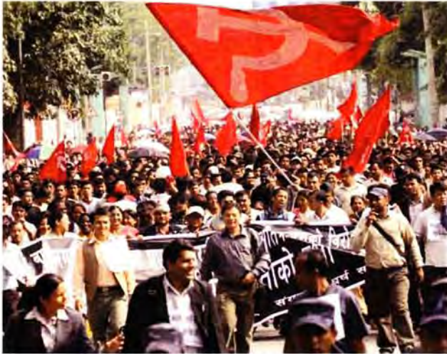
Eine von der CPI(Maoist) organisierte Demonstration zur Unterstützung eines Streiks

Basis-Massen 10 grob in 3 Kategorien unterteilt werden. Erstens gibt es die Aufgabe, die Organisation der Massen zu führen und sie in Körperschaften umzuwandeln, welche die Interessen der Massen genau vertreten. Wenn keine Massenorganisation existiert, sollte sie versuchen, eine solche zu formieren. Zweitens sollte der Gruppe die Aufgabe gegeben werden, die breiten Massen zu politisieren. Drittens sollte sie ihre Selbstverteidigung organisieren. Diese Verantwortlichkeiten sollten in den Aktivisten-Gruppen diskutiert und den Mitgliedern konkret zugeteilt werden.