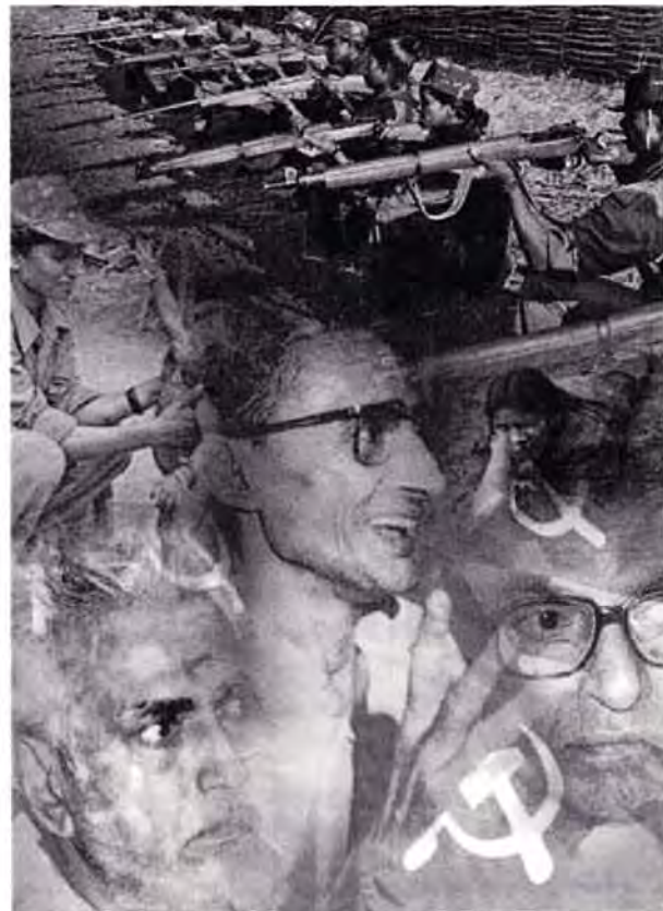
In der Mitte der Collage: Charu Mazumdar

Obwohl dieses Dokument nur als Richtlinie für Methoden zur Lösung von Widersprüchen zwischen offener und geheimer Arbeit gedacht war, gibt es auch ein explizites Verständnis für das Programm, die Aufgaben und Formen der Organisation für die Arbeiter/innenklasse, die Studierenden und anderen Fronten. Es diente folglich als hauptsächliches Dokument für die urbane Arbeit in der damaligen PW für viele Jahre.