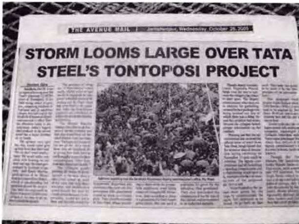
Ein Sturm braut sich bedrohlich über dem Tontoposi-Projekt von Tata Steel zusammen

Über die Jahre haben die meisten bedeutenden Städte, im Vergleich zu Geschäftsaktivitäten von Banken, Finanz- oder anderen Dienstleistungssektoren, einen Rückgang von Manufaktur-Aktivitäten erfahren. Dieser Prozess begann zuerst in den grössten Städten, mit der Schliessung von vielen Jute Mühlen in Kalkutta und anderen Industrien der späten 60er Jahre. Dieser Prozess wurde wie auch immer ein allgemeiner seit den frühen 80er Jahren mit dem Niedergang der Textil Mühlen in Mumbai, Ahmedabad, Chennai und anderen Zentren. Hunderttausende von Blaukragen-Jobs wurden zerstört ohne die Installation von irgendwelchen neuen Industrien innerhalb der Städte. Seit den letzten 20 Jahren wurde kaum eine neue Industrie in den alten bedeutenden Städten platziert. Neue Industrialisierungen werden normalerweise am Stadtrand vorgenommen oder in der Nähe von Städten. Dies ist verbunden mit einer Erhöhung der Weisskragen-Jobs im Bereich von Dienstleistungen, in die auch normalerweise Investitionen einfließen.