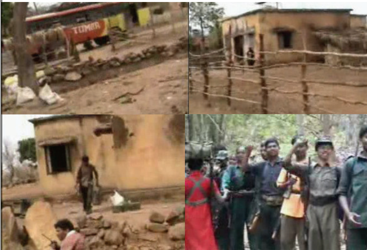
ముర్కినార్ ఆపరేషన్ దృశ్యాలు

ఈ క్యాంపు జిల్లా కేంద్రమైన బీజాపూర్కు దగ్గర్లో ఉండడం, క్యాంపులో శత్రువు నిరంతరం అలర్ట్గా ఉంటూ తమకు ఏమీ కాదనే అతివిశ్వాసంతో ఉన్న స్థితిలో ఈ దాడి జరగడం ఎస్పిఓలలో కలవరం కలిగించింది. పిఎల్జివీ ముందు, ప్రజల ముందు లొంగిపోయే ఎస్పిఓల సంఖ్య పెరిగింది. సల్వాజుడుంకు వ్యతిరేకంగా సాహసోపేతంగా పోరాడుతున్న దండకారణ్య విప్లవ ప్రజల మనోబలం ఈ దాడితో పెరిగింది. రిక్రూట్మెంట్ వందల సంఖ్యలో రావడంతో పిఎల్జివీ నిర్మాణపరంగా విస్తరించేందుకు తోడ్పడింది. శత్రు బహుముఖ దాడి ఎంత తీవ్రమైనదైనా ప్రజలు రంగంలోకి దిగి ప్రజాయుద్ధం సాగిస్తే శత్రువును ఓడిస్తామనే చారిత్రక సత్యాన్ని మరోసారి చాటిచెప్పింది.