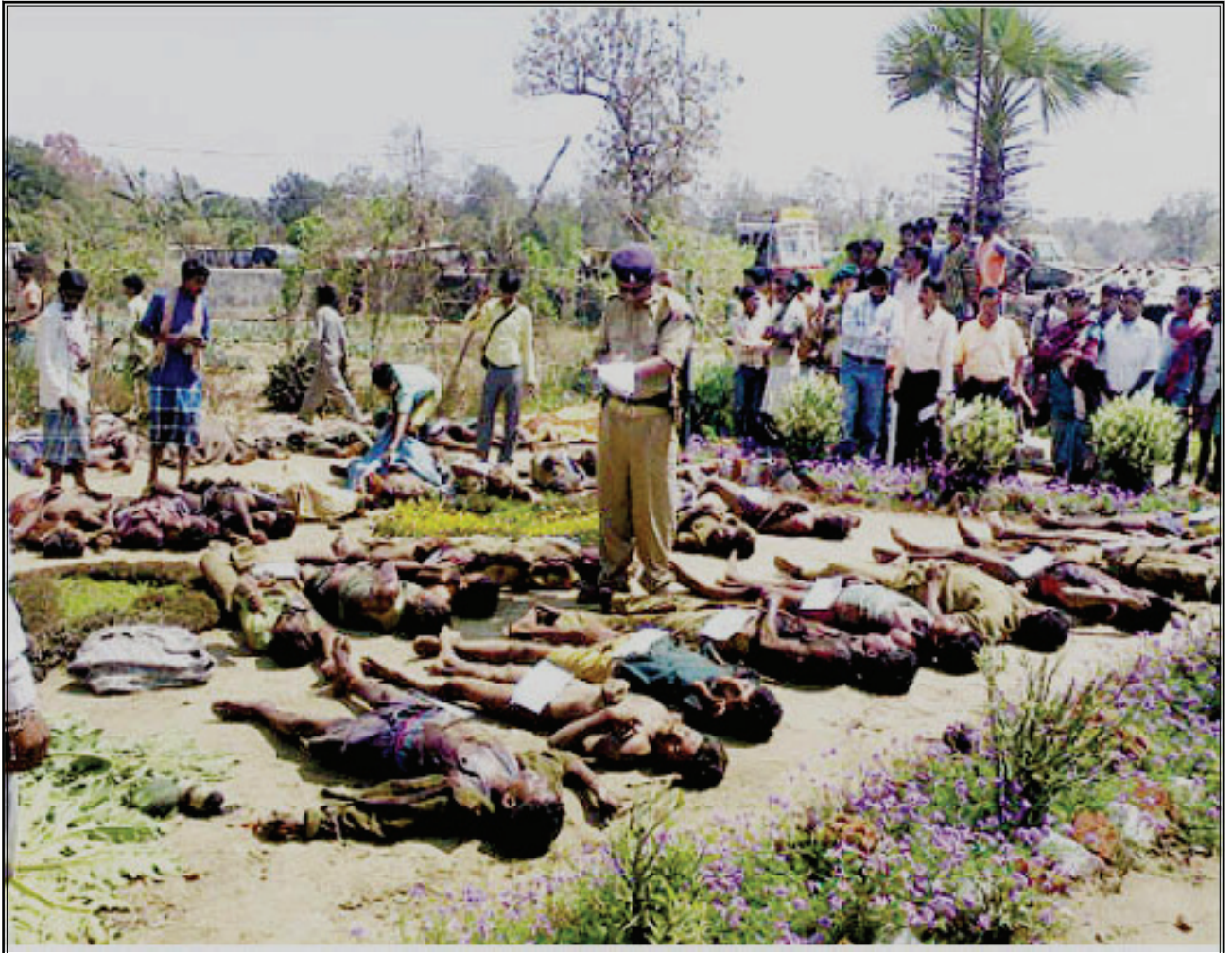
రాణిబోదిలి దాడిలో మట్టిగరిచిన ఎస్పిఓ బలగాలు