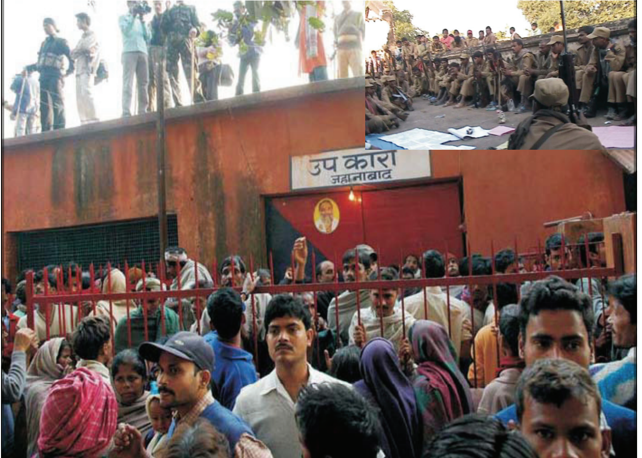
జహానాబాద్ జైలు - ఇన్ సెట్ లో పిఎల్ జివి రెయిడింగ్ పార్టీ బలగాలు