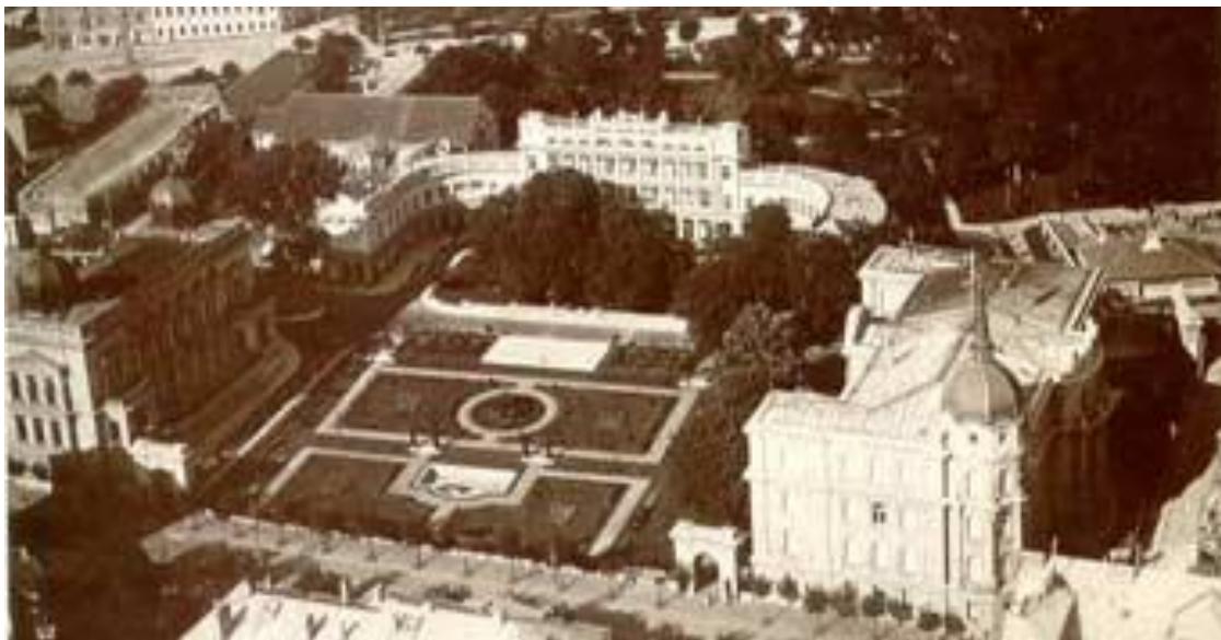
Комплекс градских дворова пре бомбардовања 1941: лево је Стари Двор, десно је Нови Двор, а између је објект Маршалата Краљевског двора и просторије гарде

У овом Двору је била званична Краљевска Резиденција, али је палата повремено коришћена и у друге сврхе. Тако је овде 1919. и 1920. године заседала Скупштина Краљевине Срба, Хрвата и Словенаца. У овом Двору су приређивани званични приједи и друге државне функције.