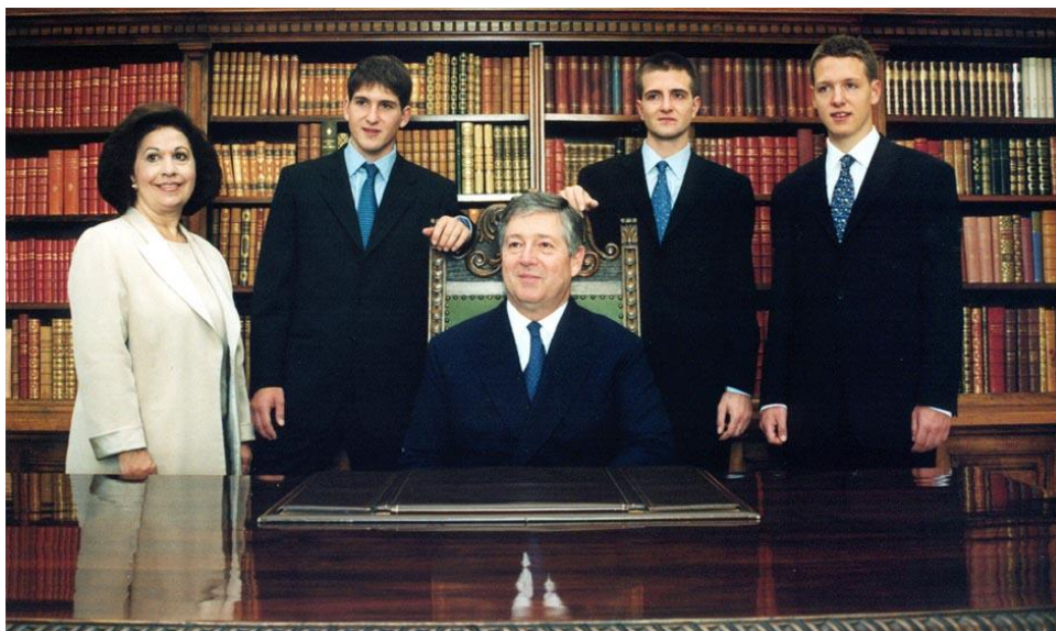
Краљевска Породица у Краљевом Кабинету у Краљевском Двору

С лева на десно: Њ.К.В. Принцеза Катарина, Њ.К.В. Краљевић Александар, Њ.К.В. Престононаследник Александар, Њ.К.В. Принц Наследник Петар и Њ.К.В. Краљевић Филип