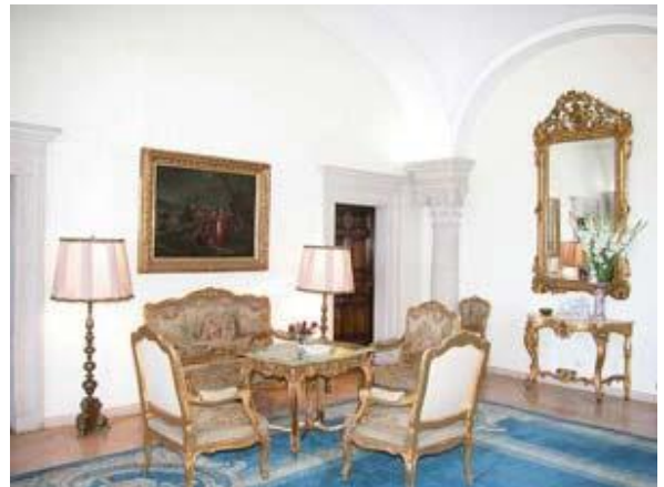
Плави салон Краљевског Двора

Просторије у приземљу су раскошно опремљене. Каменом поплочани Свечани хол украшен је копијама фресака из Дечана и Сопоћана. Плави салон је опремљен у барокном стилу, а златни салон (Палма ил Векио) у ренесансном, као и Велика Трпезарија. У тим просторијама мраморни стубови носе раскошне касетиране дрвене таванице са бронзаним лустерима. Ове су просторије украшене драгоценим сликама, шкрињама и предметима из краљевске збирке. У истом ренесансном стилу опремљене су и просторије библиотеке и Краљевог кабинета.