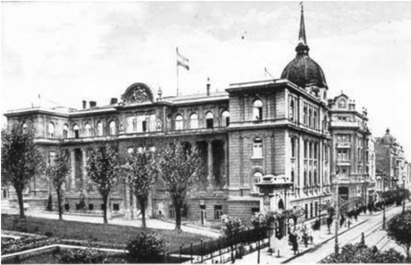
Оригинални изглед Новог двора (у згради се данас налази Кабинет Председника Републике Србије)

налазиле стамбене просторије, Краљев радни кабинет и ту су Краљ и Краљица примали посете. После убиства Краља у Марсеју 1934, године, у Новом Двору је био привремено смештен Музеј Кнеза Павла.