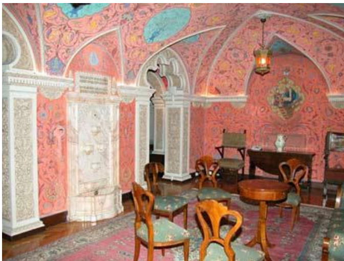
Ориентални салон или Соба шапата

На првом спрату, око великог хола такође украшеног копијама фресака из Сопоћана, распоређене су приватне просторије, низ апартмана у којима живе Њихова Краљевска Височанства Престолонаследник Александар II, Принцеза Катарина, Принц Наследник Петар и Принчеви Филип и Александар, и који су опремљени у разним стилевима, најчешће Луј ХВИ, Емпир, Наполеон III и Бидермајер. У поткровљу су мањи гостински апартмани и помоћне просторије. У сутерену су репрезентативне просторије опремљене у стилу кремаљског Теремног дворца, са сводовима и зидовима осликаним и декорисаним мотивима из бајке о жар-птици и мотивима из српских народних песама. Отуда и назив највећег салона - Чаробни. Ту се налазе и билијар сала (некада винотека) и биоскопска сала.