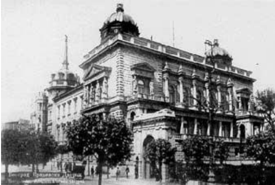
Стари двор, поглед из улице Краља Милана (у згради се данас налази Скупштина Града Београда)

Резиденција краља Петра I Карађорђевића (у периоду 1903 - 1921) и краља Александра I (1921 - 1922) био је Стари Двор који је подигао краљ Милан Обреновић у периоду 1881 - 1884 (данас је то Скупштина Града). Овај Двор је у духу академизма и са ренесансном декорацијом пројектовао Александар Бугарски. То је веома репрезентативно здање, које су првобитно красиле и две велике куполе са позлаћеним крунама на врху. Међутим како је зграда Старог Двора тешко оштећена у оба Светска рата, данашњи изглед Двора се делимично разликује од првобитног. Неки делови палате су потпуно уништени (на пример Дворска капела) или су измењени до непрепознатљивости (велико степениште, Престона дворана, итд).