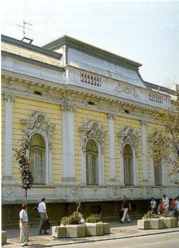
Кућа Крсмановића на Теразијама

Услед разарања у I Светском рату, оштећене зграде Градских Дворова нису могле бити коришћене, а поправка је трајала неколико година. Зато су привремено коришћени други објекти. Тако је кућа Крсмановића на Теразијама у Београду била привремена Резиденција Престоло-наследника Александра 1918. и 1919. године, и у њој је проглашено уједињење Јужних Словена у Краљевину Срба, Хрвата и Словенаца. Једна друга мања вила испод Топчидерског брда коришћена је као привремена резиденција Краља Петра I, који је у њој и умро 1921. године.