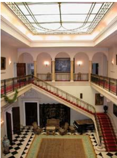
Бели двор, свечани хол са галеријом

Стриц Краља Петра II Принц Регент Павле Карађорђевић надгледао је изградњу Белог Двора. Овај Двор грађен је скоро три године (од 1934. до 1937.) и по завршетку је постао резиденција и уступљен је на коришћење Кнезу-Намеснику са његовом породицом, у очекивању пунолетства Краља Петра II.