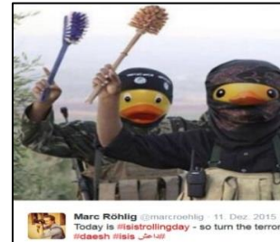
Abbildung 2: #TrollingDay

Kategorie II: Parodie und Satire umfasst eine komisch-satirische Nachahmung. Das Hacker-Netzwerk Anonymous erklärte den 11. Dezember zum „ISIS Trolling Day“ und rief auf der Webseite Ghostbin dazu auf, die satirische Stärke des Internets zu nutzen, um Memes und Cartoons zu posten, die den IS ins Lächerliche ziehen. Unter den Hashtags #TrollingISIS und #TrollingDay wurde eine Flut modifizierter ISIS Bilder gepostet. Ein beliebtes Element, das sich schnell verbreitete, war das Ersetzen der Köpfe von den ISIS-Kämpfern durch gelbe Quacksalber-Köpfe. Statt Waffen halten die Kämpfer Klobürsten in die Luft (Abbildung 2). Eine weitere beliebte Darstellung ist der ISIS in Verbindung mit Homosexualität. Der Twitter-Account ISIS_Karaoke agiert nach dem Motto „dropping songs, not bombs“ und versehrt Fotos von IS-Kämpfern mit Zeilen aus bekannten Pop-Songs. Hintergrund dazu ist das neuerliche Musikverbot des IS in Raqqa, der Hauptstadt des sogenannten Kalifats.