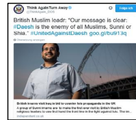
Abbildung 1 Tweet von @ThinkAgain DO

Kategorie I: Aufklärung umfasst Versuche, der terroristischen Propaganda mit Logik zu antworten, um sie so außer Kraft zu setzen. Eine bekannte Methode stellt die Verbreitung und Kommentierung aktueller Veröffentlichungen zum Thema dar. Im @ThinkAgain_DOS Tweet verbreiten und kommentieren sie einen Artikel (Abbildung 1), der einen weiterführenden Link zu einem Bericht über britische Imame enthält, die sich im Irak über den Kampf gegen die ISIS informieren. Dies geschieht in der Hoffnung, dass die Imame ihre Eindrücke aus dem Irak zu Hause verbreiten und so der weiteren Radikalisierung entgegenwirken können. Ein anderer Ansatz wird von @AverageMohamed gewählt. Er produziert Cartoons, die zum Ziel haben, Jugendliche durch Aufklärung vor Radikalisierung zu schützen. Er wirbt für Vielfalt und Toleranz und erklärt diese zu Bestandteilen des Islams, um den Argumenten der Extremisten entgegenzuwirken, es sei Allahs Wille alle Ungläubigen zu töten.