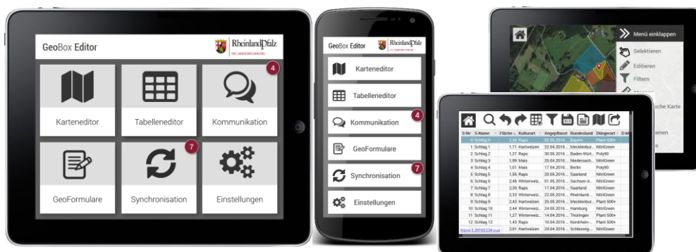
Abbildung 3: Startbildschirm/Hauptmenü (Tablet- und Smartphone-Version) (links und Mitte), Karteneditor mit ein- und ausklappbarem Menü (rechts oben), Tabelleneditor und aktive Suchfunktion nach Stichworten (rechts unten)

offene Fragen bestehen: Wie können hybride Services, die aus konventioneller Maschinenleistung mit notwendig begleitenden Datendiensten bestehen, beispielsweise über Smart Contracts abgewickelt werden? Wie müssen Interfaces gestaltet werden, welche diese Aspekte für die Zielgruppe der Landwirte umsetzen? Dies sind beispielhafte Fragen, die im Kontext aktueller Arbeiten verfolgt werden.