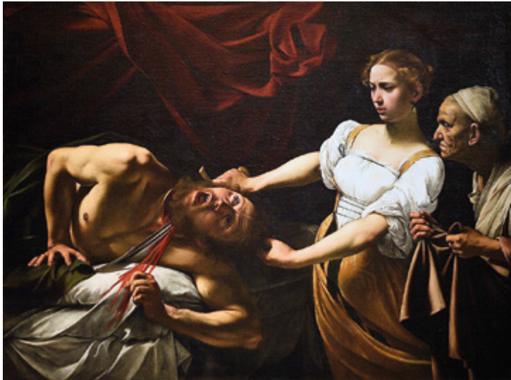
Caravaggon maalaus Judit leikkaa Holoferneen pään irti saa keskeisen roolin Lyijyvalkoisen jännitystarinassa.