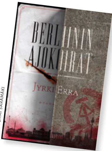
KANSI: SAMI SARAMAKI