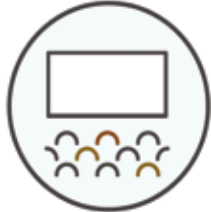
اعتماد التقرير وقبوله

تستعرض الحكومات والخبراء المسودة الثانية للتقرير والمسودة الأولى للملخص الموجه لمقرري السياسات