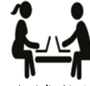
استعراض الحكومات والخبراء للمسودة الثانية

صياغة المخطط الأولي وتطويره بواسطة الخبراء الذين تعينهم الحكومات والمنظمات التي لها وضع مراقب