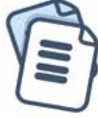
اعتماد المخطط الأولي