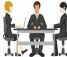
استعراض الحكومات للمسودة النهائية للملخص الموجه لمقرري السياسات

الفريق العامل/ الهيئة تعتمد الملخص الموجه لمقرري السياسات وتقبل التقرير