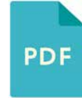
المشروع النهائي للتقرير وملخص مقرري السياسات

تستعرض الحكومات المسودة النهائية للملخص الموجه لمقرري السياسات تمهيداً لاعتماده