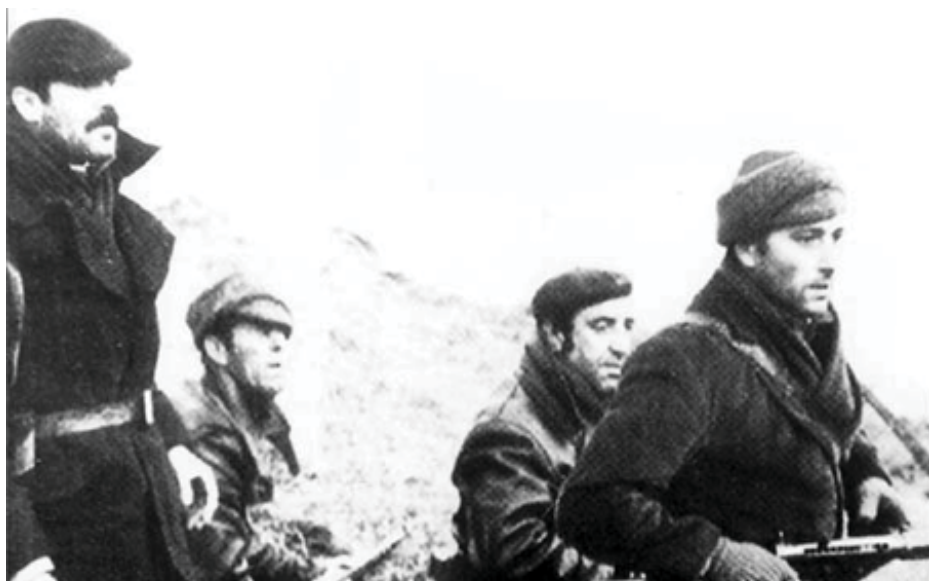
Guerilloví bojovníci; Španělsko, circa 1949

vlády s jasným cílem způsobit plánované škody mocenským institucím (státu-kapitálu a církvi), jejich zástupcům a vykonavatelům moci i s jejich posluhovači. Strategie guerilly je zaměřena na útok na srdce státu a kapitálu: do města. Akce městské guerilly směřuje k narušení „dobré funkčnosti“ systému. Všechny útoky jsou plánovány proti represivním institucím (proti fízlům, soudcům, vojákům atd.) spolu s „ozbrojenou propagandou“, popravami, obstaráváním zbraní a munice, expropriacemi, sabotážemi výrobních prostředků, ničení zboží, solidaritou s vězni a útoky proti centrům masového odcizení. Tato kombinace útoků usiluje o své rozšíření a rozmnožení rozvíjením boje proti nadvládě a je koncipována k rozvíjení „revolučního uvědomění“ mezi odcizenými davy. Podle této strategie budou „běžní lidé“ opouštět svou obvyklou pasivitu a připojí se k povstání, jakmile si uvědomí zranitelnost systému nadvlády. Avšak – a právě zde se soustřeďuje současná anarchistická kritika – praxe klasické „městské guerilly“ vyžaduje „specialisty“ a specializované „techniky,“ což znamená přijetí takzvaného „profesionálního revolucionáře“, kultu zbraní a řady specifických „nezbytností“ (úkryty, špionážní a kontrašpionážní systémy, hierarchii atd.), což nakonec končí v naprostém opuštění anarchistických idejí.