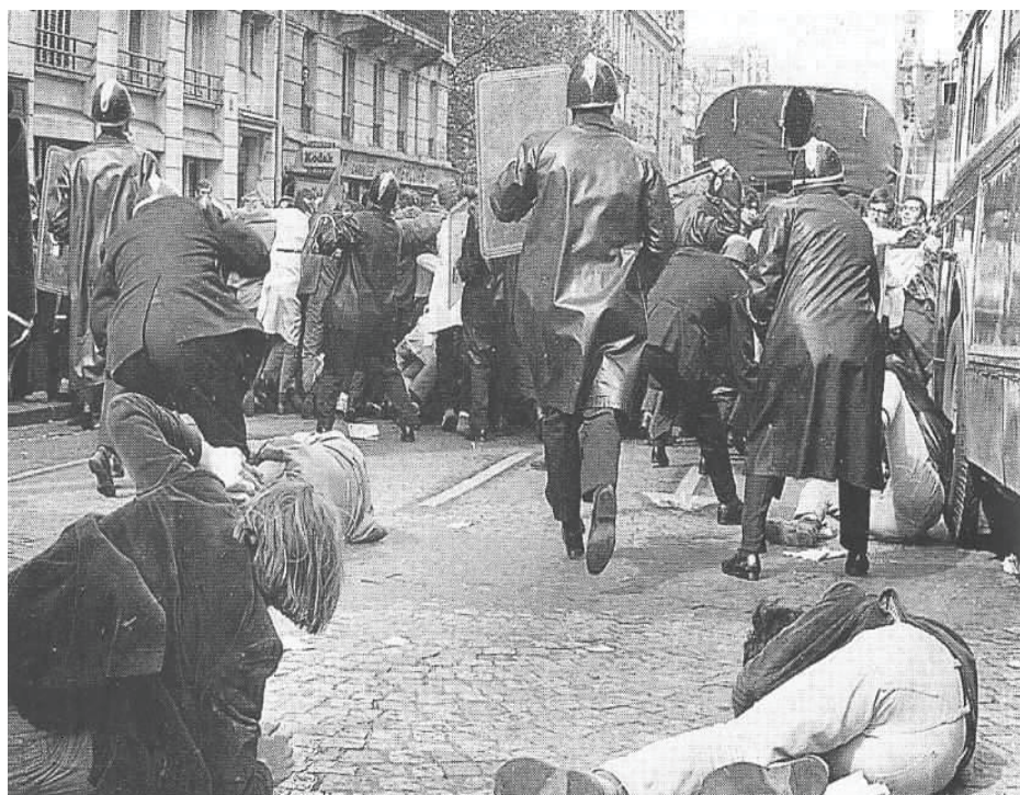
Studentské nepokoje; Paříž, květen 1968

Tento populistický pohled, který a priori odsuzuje akci uvědomělé minority a sází na „revoluční“ evoluci velkých mas, místo aby porozu- měl funkci „permanentního věření“, které jednající minority zastávají ve vývoji antiautoritářského vědomí, v jistých anarchistických kruzích ještě stále přetrvává. Problémy, kterým Rozhněvaná brigáda čelila, byly stejné, jaké tou dobou zažívaly i jiné antagonistické skupiny bez ohledu na je- jich teoretické pozice. Všechny skupiny, které odmítnou státem vytyčené limity, přejdou do ilegality a zradikalizují své boje, byly – a stále jsou – odsuzovány mimoparlamentními sociálními organizacemi uhnížděnými v legalitě. Od „dělnického hnutí“ – které bylo v té době ještě živé – přes