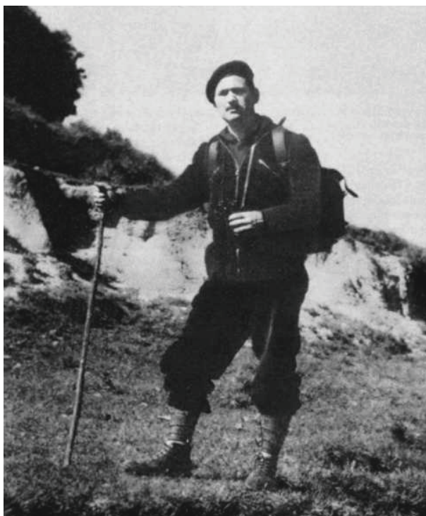
Quico Sabaté; Pyreneje, podzim 1957

buržoazií a vykořisťovanými, utlačovanými dělníky, což byla situace, která skýtala řadu okolností, které napomohly sociální konfrontaci. To umožnilo rozvoj antagonistických struktur tvořených malými akčními buňkami, které byly založené na vzájemné afinitě mezi soudruhy. Na druhou stranu se tyto malé buňky čítající něco mezi pěti až deseti soudruhy koordinovaly s jinými afinitiními skupinami na čase provádění akcí neformálním způsobem, čímž dosahovaly určité mimořádné síly, aniž by obětovaly vlastní autonomii. Takovýto způsob jednání jim umožňoval být mobilní a dovoloval jim maximalizovat efektivitu a minimalizovat rizika, tudíž znemožnil ze strany nadvlády efektivní zásah represe. Na to nedávno poukázali mexičtí povstalci a eko-anarchistické skupiny v kolektivním komuniké. Tento způsob jednání a organizování se posloužil za vzor pro Federación Anarquista Ibérica (FAI – Iberská anarchistická federace) , skupinu, která tlačila dopředu situace a okolnosti, které vyústily v pokusy o sociální revoluci v průběhu ustavování druhé republiky španělského státu.