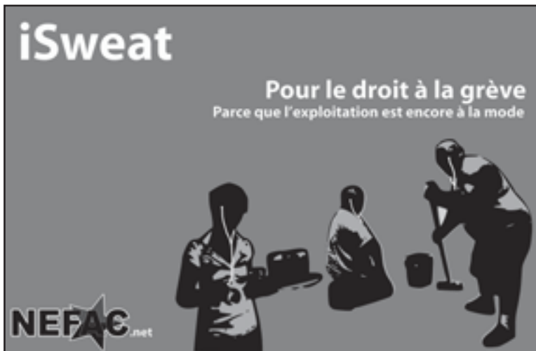
Des copies de cette affiche sont disponibles en écrivant à mtl@nefac.net