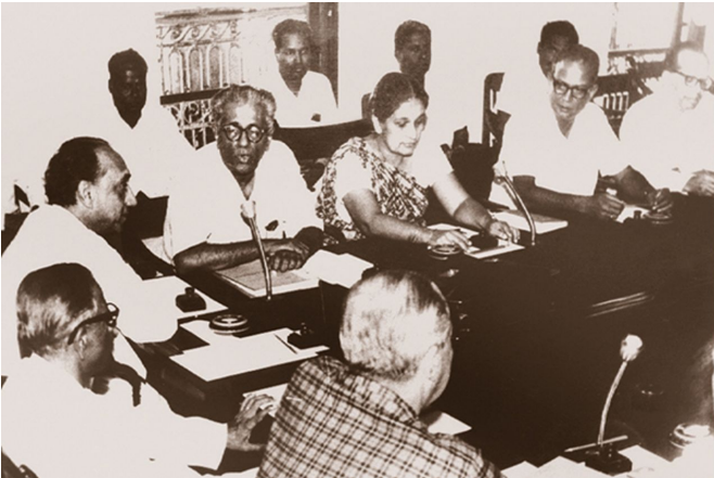
கொல்வின் ஆர். டி சில்வா பண்டாரநாயக்கவுடன் அக்கம் பக்கமாக உட்கார்ந்துள்ளார்

கணவர் படுகொலை செய்யப்பட்ட பின்னர் ஸ்ரீ லங்கா சுதந்திரக் கட்சியின் தலைவராக ஆன பண்டாரநாயக்க அம்மையார், 1964 மார்ச்சில் ஐக்கிய இடது முன்னணி (ULF) தலைவர்களுடன் பேச்சுவார்த்தையை தொடங்கினார். இந்தப் பேச்சுவார்த்தை பகிரங்கமானபோது, ஒரு சர்வாதிகாரத்தை ஸ்தாபிப்பது மற்றும் வேலைநிறுத்தத்தில் ஈடுபட்டுள்ள தொழிலாளர்களை "துப்பாக்கி முனையில் மற்றும் துப்பாக்கி ஈட்டி முனையில் வேலை செய்ய" கட்டாயப்படுத்துவது உட்பட வேறெந்தவொரு தெரிவும், "நாம் விரும்பும் இடத்திற்கு நம்மைக் கொண்டு செல்லாது," என அறிவித்து பிரதமர் தனது முடிவை நியாயப்படுத்தினார். லங்கா சம சமாஜக் கட்சி தலைவர்கள் தங்கள் பங்கிற்கு, பண்டாரநாயக்கவின் சலுகையை ஏற்றுக்கொண்டதோடு அது ஒரு "இடது நோக்கிய" நகர்வு என பொய்யாக பிரகடனம் செய்தனர்.