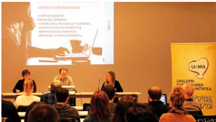
Maiatzaren 4an egin zuen UEMAK agintaldi honetako azken batzar nagusia, eta azken lau urteotako balorazioa egin zuten udalerrri euskaldunetako zingotzi, alkate eta udal ordezkariak.

2015-2019 agintaldia amaitzearekin batera, ATZERA BEGIRATU eta azken LAU URTEOTAKO JARDUNAREN ERREPASOA egin du UEMAK. Batez ere HORRETARAKO baliatu zuen maiatzaren 4an AZPEITIAN egin zuen Batzar Nagusia. BERTAN, UEMAREN BERDINTASUN PLANA onartzearekin batera, amaitu BERRI DEN AGINTALDIKO BALANTZEA egin zuten UDALERRI EUSKALDUNETAKO DOZENAKA ALKATEK eta ZINGOTZIK. UDALERRI EUSKALDUNAK LEGEZ BABESTEKO eman diren PAUSOAK SENDOTZEA, eta UDALERRIAK GARATZEKO PROPOSATU DIREN OINARRIEN GAI NEAN LANEA HASTEA IZANGO DIRA AGINTALDI BERRIKO LEHEN ERRONKAK.