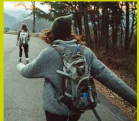
Ibiltaria izango da aurten gazteen topaketa, eta lau udalerrri euskaldunetan egingo dute geldialdia gazteek.