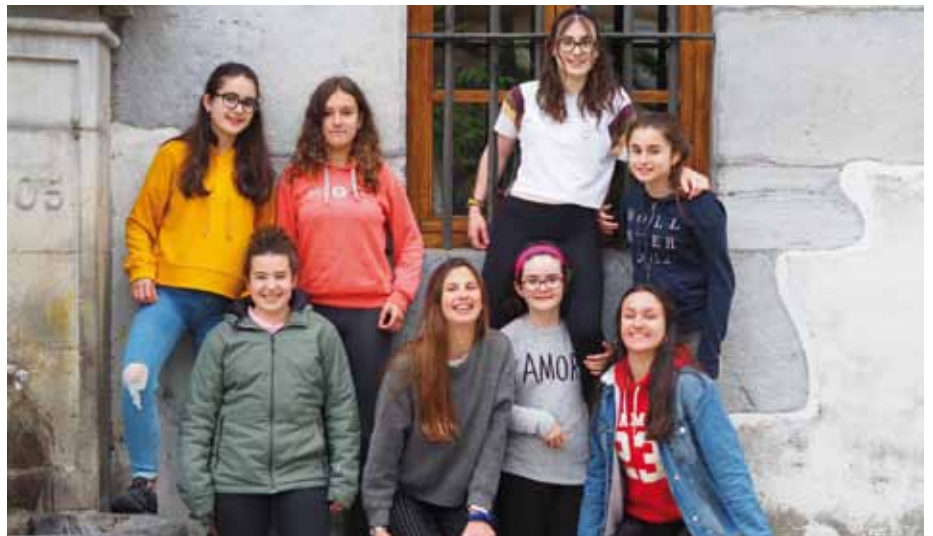
Lauro ikastolako hainbat gaztek astebeteko egonaldia egin zuen apirillean Goizuetako eta Azpeitiko familietan.

Hori irauli nahian abiarazi dute harrera familien egitasmoa, inguru erdaldunetako gazteek euskaraz bizi diren eremuak ezagutu ditzaten eta ondoren beraien inguru