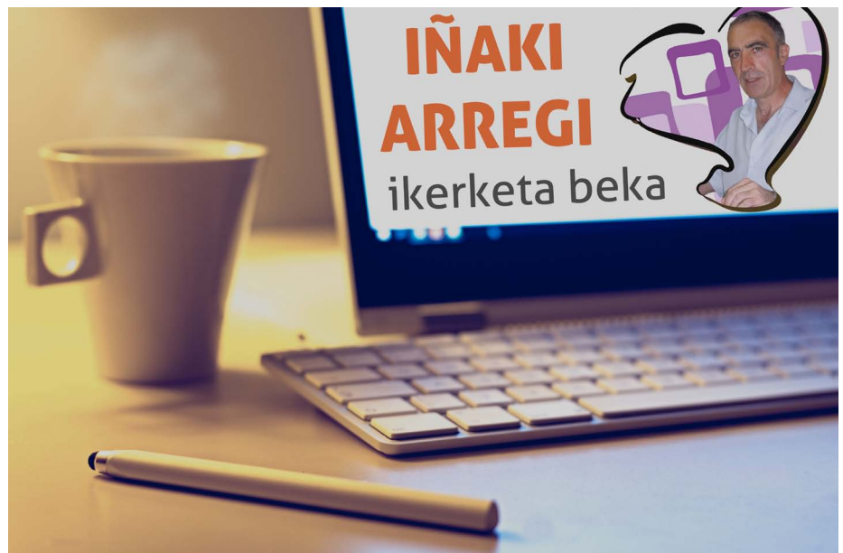
Uztailaren 24an amaituko da Iñaki Arregi Bekaren lehen deialdira aurkezteko epea.

UDALERRI EUSKALDUNAK GARATzea DA EUSKARAREN ARNASGUNEELI SENDO EUSTEKO MODU ERAGINKORRENA. ONDORIO HORRERARA HELDU ZIREN IAZ UEMA, KONTSEILUA, UDAKO EUSKAL UNIBERTSITATEA ETA GAINDEGIA, ETA UDALERRI EUSKALDUNAK GARATZEKO HAINBAT IRIZPIDE ETA OINARRI PROPOSATU ZITUZTEN, HORIEK GUZTIAK HAINBAT ARLOTAKO ADITUEKIN BATERA AZTERTU ONDOREN. ORAIN, OINARRI HORIEK AINTZAT HARTUTA, UDALERRI EUSKALDUNAK GARATZEKO ADIBIDE PRAKTIKOAK AZTERTU ETA ABIARAZI NAHI DITUZTE AGINTALDI BERRIAN. HORRETTARAKO, IÑAKI ARREGIREN OMENEZKO BEKA SORTU DU UEMAK, ETA BI LAN SARITUKO DITU LEHEN DEIALDIAN, BAKOITZA 5.000 EUROREKIN.