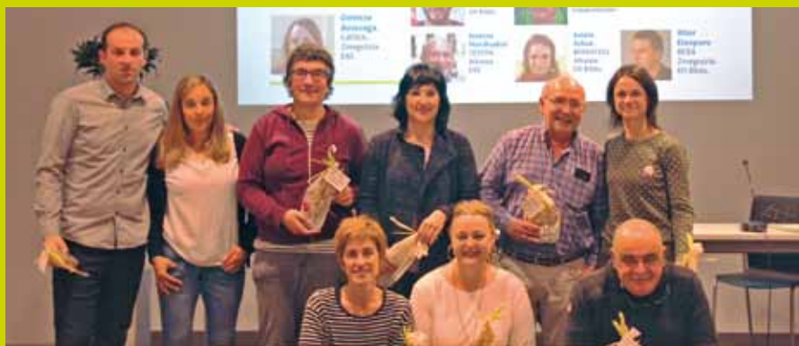
UEMAREN zuzendaritza batzordea osatzen duten hainbat ordezkari, maiatzaren 4an, batzar nagusiaren amaieran.