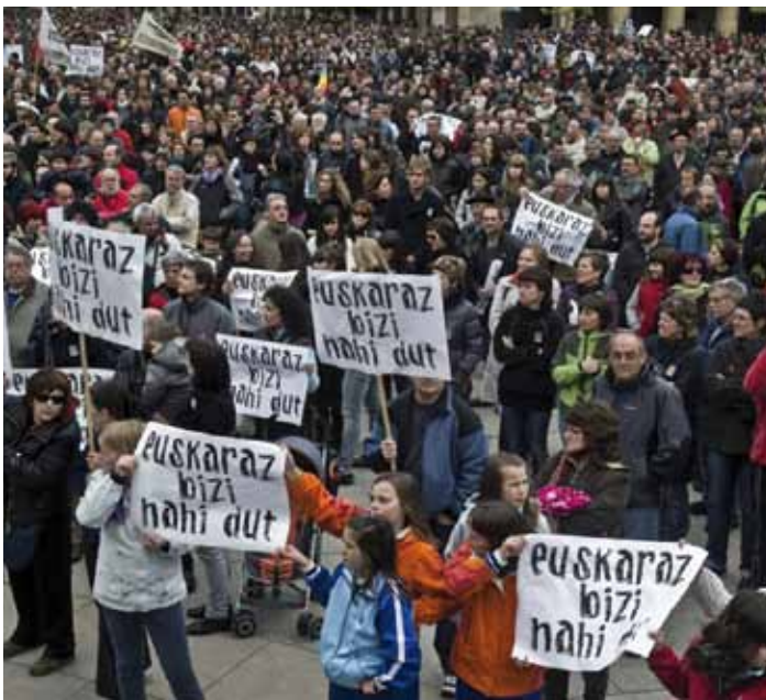
Euskara Nafarroa osoan ofiziala izan dadin eskatzeko eta Euskararen Lege berria aldarrikatzeko azken urteotan hainbat aldiz atera dira herritarrek kalera Nafarroan.

MARTXOAREN HASIERAN NAFARROAKO GOBERNUAK EUSKARA PLANAK MARTXAN JARRI ZITUEN BERE DEPARTAMENTUETAN, EUSKARAREN ERABILERA SUSTATZEKO ETA HERRITARREN HIZKUNTZA ESKUBIDEAK BERMATZEKO. HORIEK UDALERRI EUSKALDUNETAKO HERRITARRENGAN ETA ZERBITZUETAN DUTEN ERAGINA KONTUAN HARTUTA, UEMAK "ELKARBIZITZAN SAKONTZEKO ETA HERRITARREN ESKUBIDEAK BERMATZEKO" AURRERAPAUTSOTZAT JO ZITUEN.