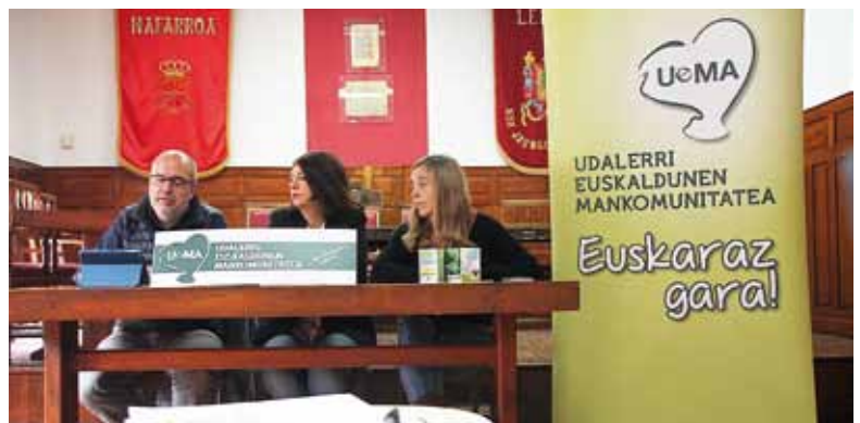
Apirilean Leitzako udaltxean egindako agerraldian aurkeztu zituen UEMAK bisitarietarako egindako galdetegiaren emaitzak, Ahize-AEK aholkularitzako eta Leitzako Udaleko teknikariek batera.

TURISMOAK GORA EGIN DUEN HAINBAT UDALERRI EUSKALDUNETAN, BISITARIEK EUSKARAREKIKO DUTEN IKUSPEGIA AZTERTU DU UEMAK, INKESTEN BIDEZ. JASOTAKO ERANTZUNETAN JOERA ARGIA IKUSTEN DA: BISITARI IA GUZTIEK ESKERTU EGITEN DUTE EUSKARA IKUSTEA EDO ENTZUTEA, ETA ASKOK BERARIAZ HAUTATZEN DU UDALERRI EUSKALDUNETARA ETORTZEA, EUSKARAREKIN TOPO EGITEKO. DATUAK ADIERAZGARRIAK DIRA, ETA TURISMO EREDUAREN INGURUKO HAUSNARKETA EGITEKO AKUILU IZANGO DIRA. ZEHAZKI, EUSKARA ETA TURISMOA NOLA UZTARTU AZTERTZEKO JARDUNALDIA ANTOLATU DU UEMAK, LEHEN ALDIZ. AZAROAREN 21ean izango da.