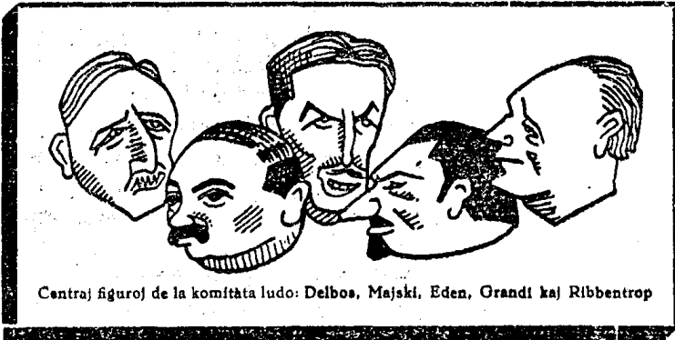
Centraj figuroj de la komitata ludo: Delbos, Majski, Eden, Grandi kaj Ribbentrop

ELDONO DE GRUPO LABORISTA ESPERANTISTA VALENCIA (Hispanio) REDAKCIO KAJ ADMINISTRACIO: STRATO MAR, NUM. 25