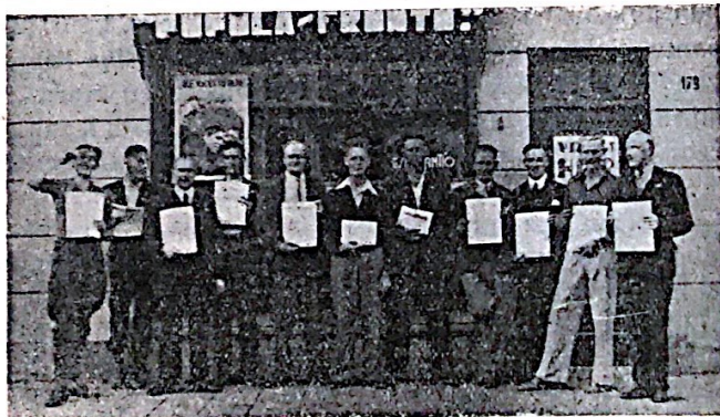
Aktiva diverstendeca grupo da amikoj el Hago, kiuj senlace laŭporas en la nederlandlingva POPOLA FRONTO

Ni insistos, se necese, pri la sama temo!