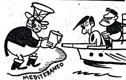
GRANDA POTENCO PETAS ALMOZON —Ĉu vi permesas al mi preni lomete da akvo?

● Estas farita bilanco pri la viktimoj de kanonpafo al civila loĝantaro de Madrido. Oni ne povis kalkuli la nombron koncernantan la antaŭurbajn kvartalojn. Ankaŭ ne estas