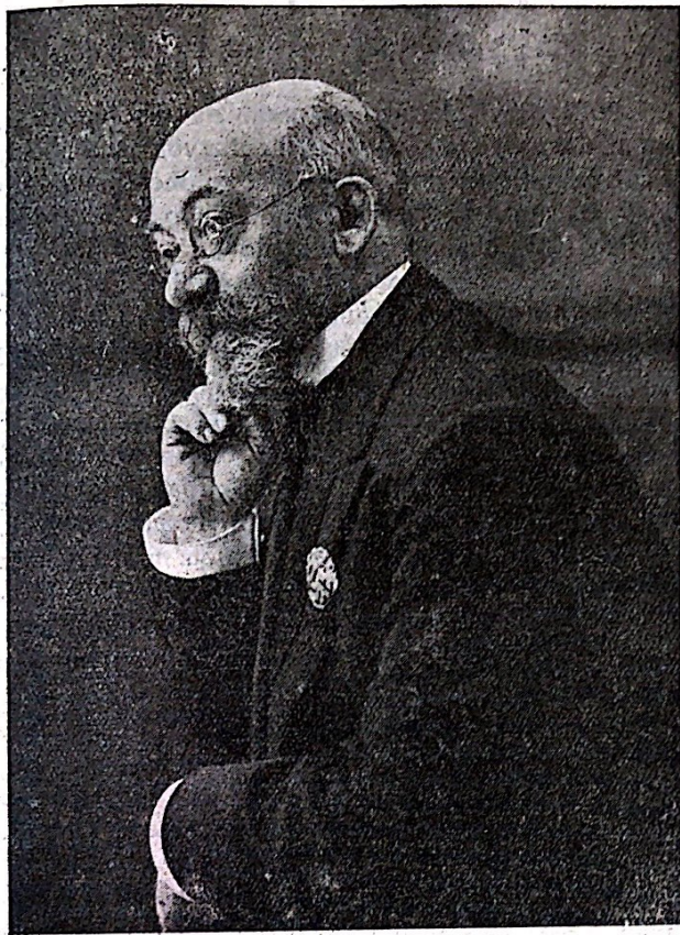
Tute nekonata portreto de Zamenhof, farita en Valencio mem en la jaro 1909. Okaze de la vizito, kiun li faris al nia urbo post la 5. a Universala Kongreso en Barcelono

La apero de ĉi tiu numero de POPOLA FRONTO preskaŭ koincidas kun la 20 a datreveno de la morto de nia kara D-ro Zamenhof; tial ni kredas oportune montri nian estimon k respekton, por la genia kreinto de Esperanto, prezentante omaĝe la sociajn trajtojn de lia simpatia persono, en rilato al nia specifa rolo. Zamenhof, modesta kuracisto, laŭ socia deveno estis mezklasano; esplorante tra fizikaj doloroj li volis ankaŭ kuraci moralajn suferojn; serĉante solvon en tiu direkto, kun orientana pacienco, li plure prilaboris la fundamenton de nia lingvo. Li serĉis unuecon por amo k paco per interkompreno, kun interna ideo pri homaranismo. Kvankam, pri ĝenerala politiko, li ĉiam prezentis sin kiel neŭtrala homo, li volis progreson k liberon por ĉiuj homoj feliĉe komprenante unu la alian... Ni rajtas do sekve aserti, sen ofendo por lia rememoro, ke li estis liberala k antaŭnema civitano.