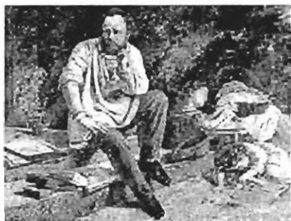
۳. ژوزف پیر پرودون (۱۸۰۹-۱۸۶۵)