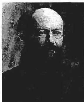
۵. پتر کروپانکین (۱۸۴۲-۱۹۲۱)