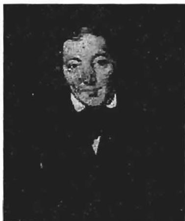
۲. رابرت اوون (۱۷۷۱-۱۸۵۸)