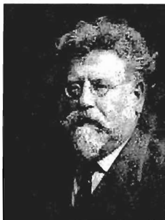
۶. رودولف راکر (۱۸۷۳-۱۹۵۸)