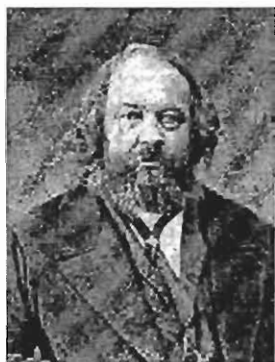
۴. میخائیل باکونین (۱۸۱۴-۱۸۷۶)