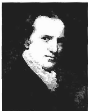
۱. ویلیام گادوین (۱۷۵۶-۱۸۳۶)