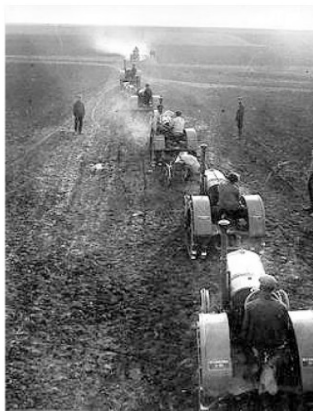
Un koljos en 1932. Esta forma de organización colectiva, sino va acompañada de la correcta politización de sus integrantes puede llevar intereses individuales antes que los colectivos, una muestra que en el socialismo aún se expresa la lucha de clases.

ra el socialismo, la cual ya se desarrolló en países como Rusia y China en su momento. La perspectiva de la sociedad no es a eternizar el sistema capitalista, sino que la perspectiva es al cambio y transformación social, la que llevara al socialismo.