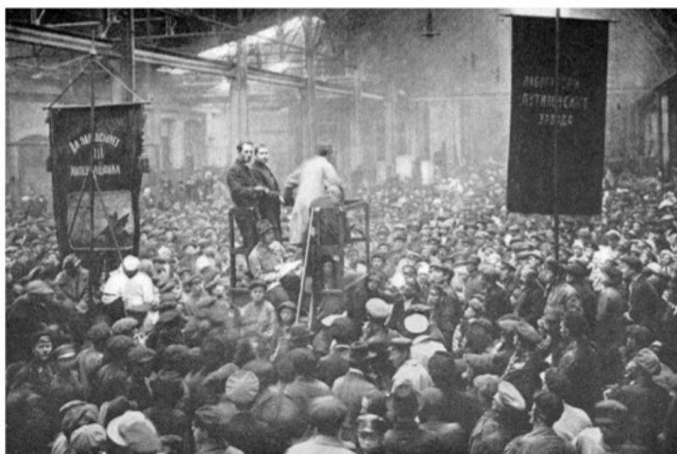
"¡Todo el poder a los soviets!" La asamblea de obreros, campesinos y soldados fue el germen del nuevo poder

sa. El 4 de diciembre el Soviet de Moscú lanza el orden de transformar la huelga en curso en una insurrección armada, el 9 los destacamentos gubernamentales incursionan a sablazos a las reuniones de los obreros, a partir de ahí se construyen barricadas, el gobierno lanza a la lucha a su Guardia Imperial, la lucha se tornó encarnizada, barrio por barrio, los días 16, 17 y 18 de diciembre la insurrección fue aplastada y ahogada en sangre. Lenin escribiría después "El proletariado había sentido, antes que sus dirigentes, la evolución de la lucha que exigía pasar de la huelga a la insurrección..." La reacción se lanzó a la persecución, destierro, cárcel y muerte de los revolucionarios. La insurrección de 1905 había fracasado. Pero no todo estaba perdido, Lenin escribiría "El partido obrero y sus tareas del momento" donde se organizaba el repliegue, el gobierno enterado de esto se lanzó contra su autor, pero no pudieron atraparlo, Lenin siguió con su trabajo revolucionario. Luego se trasladaría a París, desde donde iniciaría una nueva ofensiva que terminaría en octubre del 1917 con el triunfo de la revolución. En febrero del 17 se produce el ascenso de Kerensky al poder y Lenin adopta una posición abiertamente en contra del Gobierno Provisional, pues impedían las reformas que exi-