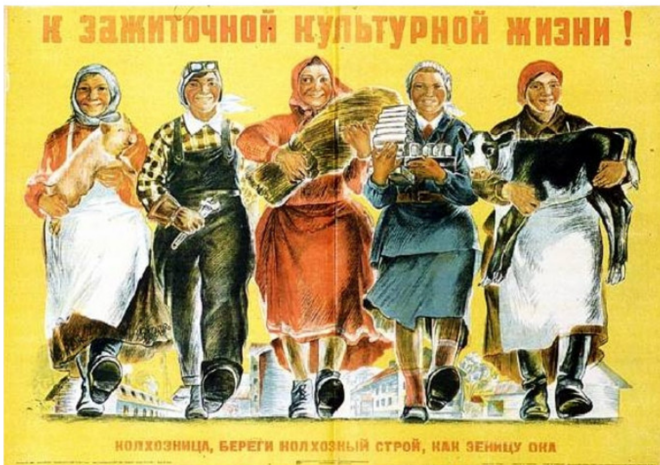
Las mujeres en la URSS no solo consiguieron muchos derechos económicos, sino también políticos, siendo el primer país en participación política de mujeres, mientras que en los países imperialistas se discutía si las mujeres tenían derecho al voto.

cialismo en las condiciones de un país como Rusia con fuertes retrasos en su desarrollo de las fuerzas productivas) se aplicó en todo el territorio la colectivización, y para ello se aplicó los planes quinquenales. Para 1930, a inicios del primer plan quinquenal el sector sociabilizado de la producción agrícola e industrial es del 56%, asimismo el 60% de la renta nacional esta socializado, así mismo en cuanto al comercio, todo el comercio al por mayor esta socializado, así como el 83% del comercio al por menor. A fines del primer plan quinquenal ya la producción agrícola en sus \frac{3}{4} partes estaba socializado, controlando los koljos el 90% de la superficie total de la siembra. Con la aplicación del segundo plan quinquenal la agricultura se desarrolla mucho más, ya que se lleva a cabo la mecanización del campo, así se pasa de tener 2 millones de tractores en 1932 a poseer 8 millones de tractores para 1937. Todo esto eleva el nivel de vida de millones de campesinos en todo el territorio de la URSS. Y esto sí solo vemos el sector agrícola, porque la industria y el comercio también