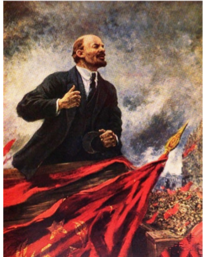
Lenin, a través de su vida y obra, encarnó los intereses del proletariado, llevando al partido bolchevique hacia la conquista del poder en Rusia.

despotismo salvaje de aquel régimen, la importancia de la “Unión de lucha por la emancipación de la clase obrera” de Petersburgo estriba en que esta organización era, según Lenin, el primer comienzo serio de un Partido revolucionario. La experiencia adquirida por Lenin en esta etapa de su vida le sirvió para su actuación posterior como creador de la vanguardia del proletariado y jefe de la revolución de octubre. Por esos años, empezó a escribir valiosas obras: libros, folletos, miles de artículos y cartas, ahí tenemos sus libros “el Desarrollo del Capitalismo en Rusia”, “¿Qué hacer?”, “Materialismo y Empirio-criticismo”, “El Estado y la Revolución”, “El imperialismo fase superior del capitalismo” y otras obras que nos alumbran hasta hoy. Diez meses después de su detención, Lenin es deportado por tres años a Siberia oriental, tenía treinta años cuando se empeña a la gran tarea de construir el Partido. A principios del mes de marzo de 1898 se celebró en Minsk el Primer Congreso de Organizaciones Socialistas de Rusia, don-