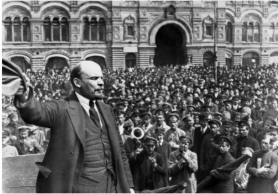
Lenin dirigiéndose al pueblo ruso en Moscú. 1919

Así, Lenin como jefe del Partido Comunista Bolchevique, participó en la revolución de 1905, "el ensayo general" como él lo llamó, en la de febrero de 1917 y dirigiendo la revolución socialista de octubre de 1917. Inmediatamente, encabezó el trabajo por la edificación del Estado socialista, pasando a implementar su Programa, negociando la salida de la guerra en el Tratado de Brest-Litovsk firmado el 3 de marzo de 1918, decretó la repartición de las tierras al campesinado pobre sin indemnización y se recono-