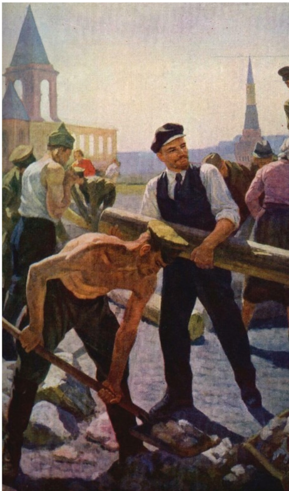
Lenin y el proletariado forjando el futuro en los sábados comunistas.

Así la emulación socialista es acción política revolucionaria que transforma la vida material y espiritual del pueblo soviético.