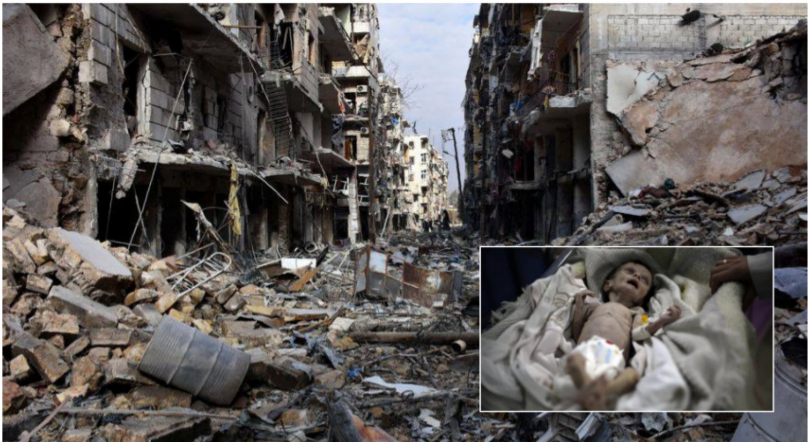
La pugna entre potencias por el control de zonas de influencia ha llevado la guerra a Siria, desangrando hasta hoy a cerca de medio millón de personas, y dejando una nación destruida y la insultante realidad de los niños desnutridos de Siria.

Caracter parasitario del imperialismo Sobre esa base monopolista del imperialismo hay que añadir el carácter parasitario del mismo, no se mantiene por su participación en el proceso pro-