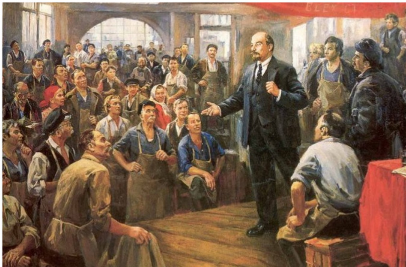
Lenin fundó el partido bolchevique como la organización más elevada del proletariado concibiendo a esta como una clase verdaderamente revolucionaria.

xismo, al desarrollo del proletariado y su Partido, los primeros preconizaban que el proletariado debía luchar solo por reivindicaciones económicas y dejar que la lucha política la realicen los letrados o profesionales; y los segundos pensaban erróneamente que la fuerza revolucionaria fundamental era el campesinado y no la clase obrera, no comprendían que la clase obrera era la más revolucionaria y avanzada de la sociedad. Lenin desnuda y combate estas posiciones en su libro "Quiénes son los amigos del pueblo" aquí plantea por primera vez la idea de la alianza revolucionaria entre los obreros y los campesinos como medio fundamental para derrocar el poder del zarismo.