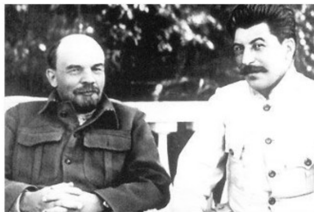
Lenin y Stalin en 1922

Finalmente, para remarcar la labor de Lenin en su fructífera vida, recordemos lo señalado por Stalin en su Discurso "Con Motivo de la Muerte del camarada Lenin", dijo: "Durante 25 años Lenin educó al Partido e hizo de