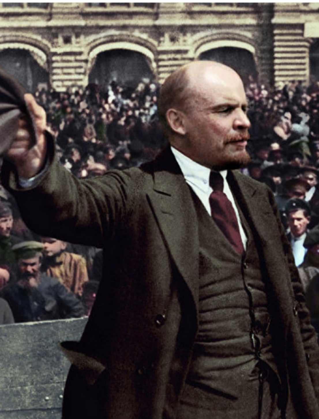
LENIN: ¡Gran titan del pensamiento y la acción, Jefe de la primera sociedad socialista!

La fructífera labor de Lenin en beneficio del proletariado internacional es imborrable. Como continuador de Marx, le cupo a Lenin defender la ideología del proletariado que al igual que hoy, era atacada; en esa ejemplar labor, en medio del análisis de la nueva realidad del siglo XX, va a concretar grandes desarrollos de la concepción científica del proletariado, las que a continuación sintetizamos: