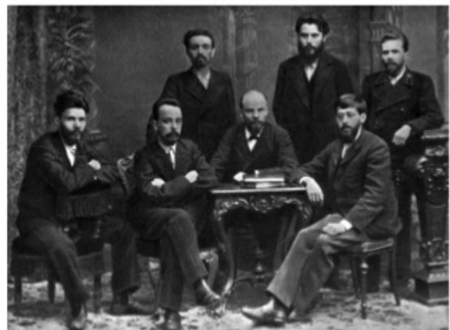
Lenin entre los miembros del comité de la Unión de Lucha por la Emancipación de la Clase Obrera de San Petersburgo. 1895

de se tomó la decisión de formar el Partido Social Demócrata Ruso, se eligió su comité central, a los pocos días fueron detenidos pero el hecho existió, ya había Partido en Rusia y Lenin con profunda convicción, asumió la tarea de su construcción, lo primero era que la militancia asumiera la necesidad de una