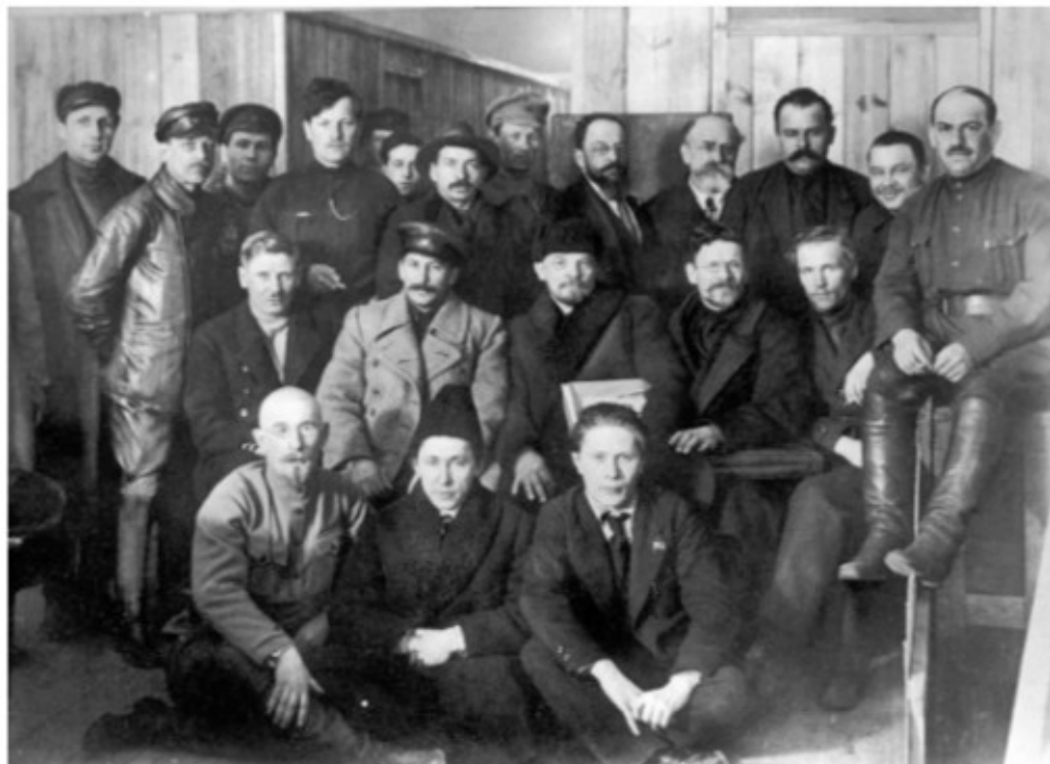
Lenin con los delegados del VIII Congreso del Partido Bolchevique. 1919

cieron los derechos de las minorías nacionales, entre otras importantes medidas.