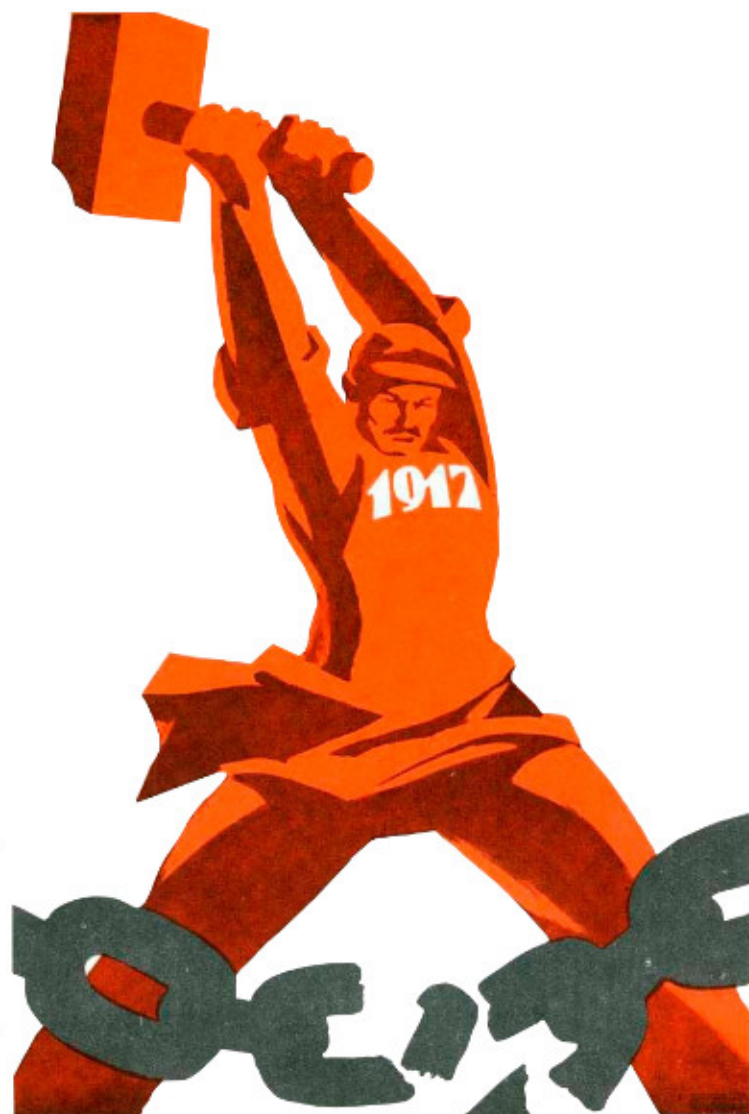
A 100 años de la Revolución Rusa, el proletariado y los pueblos del mundo siguen combatiendo contra la explotación. Reafirmarnos en la necesidad y factibilidad del socialismo.

Estamos resueltamente por la paz y contra la guerra. No obstante, si los imperialistas insisten en desencadenar una guerra, no debemos sentir temor. Nuestra actitud ante este asunto es la misma que ante cualquier otro desorden: en primer lugar, estamos en contra, en segun-