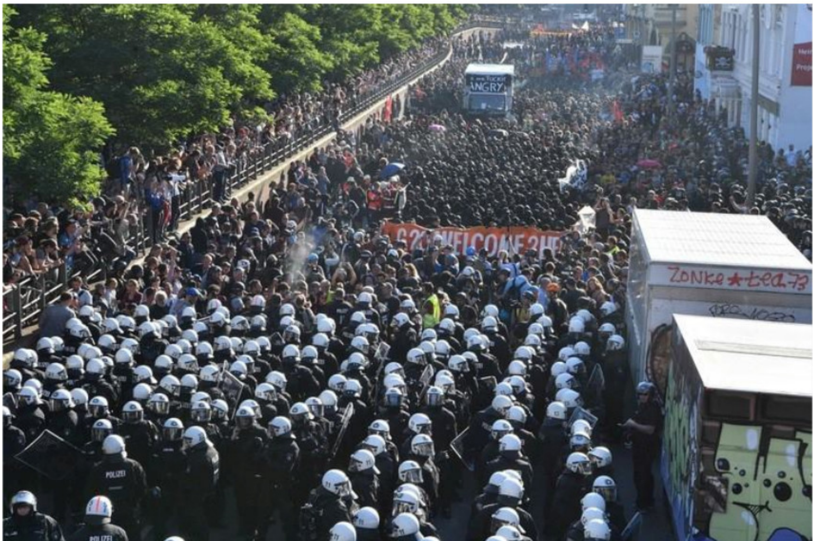
Grandes movilizaciones a nivel mundial expresan el rechazo de las masas a este orden de explotación y miseria.

La situación política internacional demanda que los pueblos del mundo luchen contra los planes del imperialismo oponiendo a su guerra de rapiña los intereses del proletariado y del pueblo, en función a desarrollar el camino hacia el socialismo.