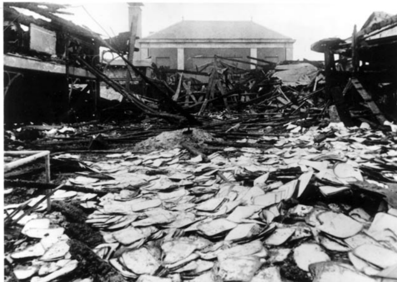
Ravage na de aanslag op het bevolkingsregister in Amsterdam in 1943.

Daarna bleef het lang stil, maar na de aanslagen van 11 september 2001 laaide het debat weer op. Eerst nog alleen over uitbreiding van identificatieplicht bij dreiging van een aanslag, maar al rap was er een meerderheid voor de algehele identificatieplicht.