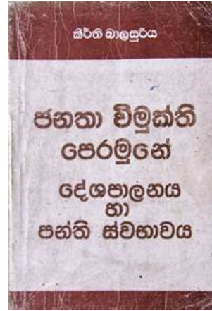
மக்கள் விடுதலை முன்னணியின் அரசியலும் வர்க்கத் தன்மையும்