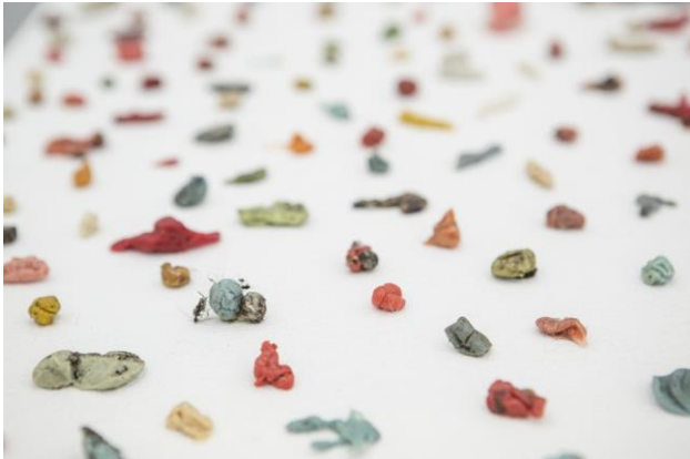
[Xiclets i altres restes recollits als carrers de Nova Iorque per l'artista Yuji Agematsu]

Amb les seves teories sobre els fòssils, Curvier va proposar una nova forma de pensar sobre l'anatomia, la temporalitat, el canvi, el medi ambient i els nostres efectes sobre aquest. Un fòssil només es considera com a tal si la seva edat supera els 10.000 anys – una xifra arbitrària que immediatament obliga a repensar el sentit de la història, no només als paleontòlegs. Aquests nous objectes d'estudi científic que contenen rastres d'objectes i espècimens desapareguts, van provocar una revolució epistemològica en el període romàntic que va sacsejar les pròpies nocions de la mortalitat, l'absència i, sobretot, l'escala.