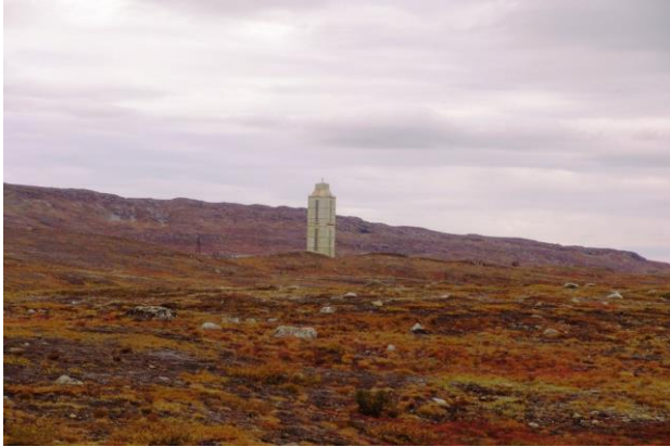
[El Pou Superprofund de Kola]