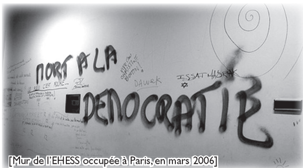
[Mur de l'EHESS occupée à Paris, en mars 2006]

durant un moment. Portées par une minorité au sein de la minorité et peu compatibles avec le fonctionnement des AG souveraines pratiquant le centralisme démocratique elles n'ont pas provoqué l'ébullition, très vite sur Paris il y eut surtout des initiatives fortement centralisées et planifiées en interfac (l'action obligatoire du mardi et du jeudi). Parmi les activistes estudiantins, de plus en plus se sentent coincés dans un carcan autolimitatif et partent s'organiser ailleurs, certains se voient en groupes de potes, d'autres rejoignent l'EHESS, d'autres changent de fac ou errent de manifs en actions.