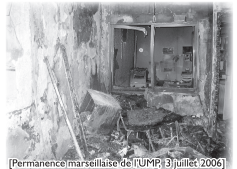
[Permanence marseillaise de l'UMP, 3 juillet 2006]

de Bordeaux est en cours afin de déterminer l'origine du tir et la nature de l'arme. Le syndicat Synergie officiers rappelle que ce commissariat n'avait pas de vitres blindées comme le préconisent les normes de sécurité.