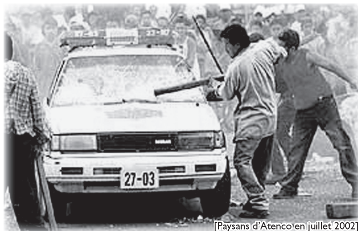
[Paysans d'Atenco en juillet 2002]

Les nouvelles élections du 12 octobre 2003 provoqueront les 29/30 novembre une baston générale lors de l'investiture du maire PRI (20 blessés).