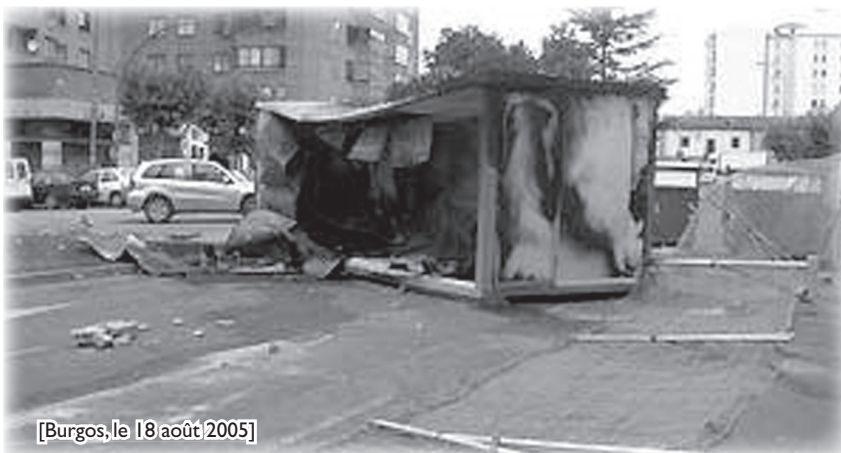
[Burgos, le 18 août 2005]

Fin mai 2006, la Mairie rendra public au moyen d'une intense campagne de criminalisation dans les médias locaux, l'accusation à l'encontre des huit