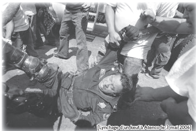
[Lynchage d'un keuf à Atenco le 3 mai 2006]

Les vendeurs de fleurs ambulants d'Atenco n'ont pas commencé à se révolter contre l'Etat-Capital en ayant conscience de leur condition d'oppriméEs et d'excluEs, ni avec l'intention de propager la confrontation pour en faire une insurrection généralisée. Ils et elles se sont révoltés en "petits commerçants", en "citoyens" en colère pour la défense de leurs "droits", du "droit au travail", du "droit à la subsistance" du "droit à la survie", contre la menace d'expulsion émanant de la municipalité aux mains de ces chiens du PRD (centre-gauche). Et c'est là, au delà de la répression, que nous voyons les limites de la révolte, dans les propres limites