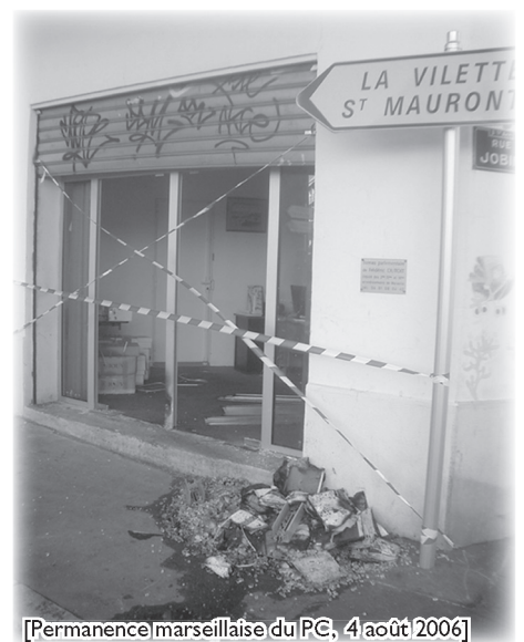
[Permanence marseillaise du PC, 4 août 2006]

(presse) Le commissariat de Pessac victime d'un coup de feu. Dans la nuit de lundi à mardi, une balle a traversé la vitre du poste de police pour se fiche dans un mur. Personne n'a été atteint. Une enquête réalisée par le parquet