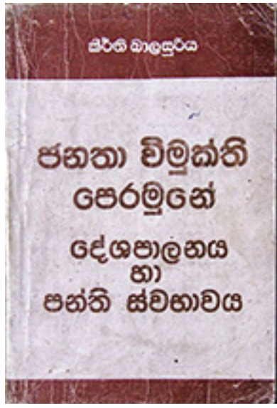
(ජනතා විමුක්ති පෙරමුණේ දේශපාලනය හා පන්ති

එම නිගමනය කරා එලැඹී බාලසූරිය, මාඕ කස්චෝ හා හෝ වි මින්ට තැරවිකාරකම් කිරීමේ "මධ්‍යම පන්තික රැඩිකල්වාදයේ සංක්ෂේපයට (සංකේතාත්මක මූර්තිය)" පැවැති ජවිපෙය දේශපාලනිකව හා න්‍යායිකව හෙලිදරව් කිරීමට තීරනය කලේය. ඔහු විකොස සිංහල පුවත්පත වූ කම්කරු පුවත් හි ජනතා විමුක්ති පෙරමුණේ දේශපාලනය හා පන්ති ස්වභාවය යන මායෙන් යුත් ලිපි පෙලක් පල කල අතර එය පසුව පොතක් ලෙස ප්‍රකාශයට පත් කෙරින.