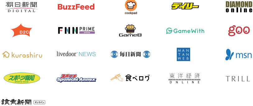
主要提携パートナーサイト(2020年7月現在 ※アルファベット順)