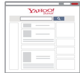
※画像はサンプルです。 実際の表示とは異なる場合があります。

「Nielsen MobileNetView」2019年7月～12月平均(Yahoo! JAPAN(ブランドレベル)で集計、スマートフォンからのアクセス(アプリの利用を含む))