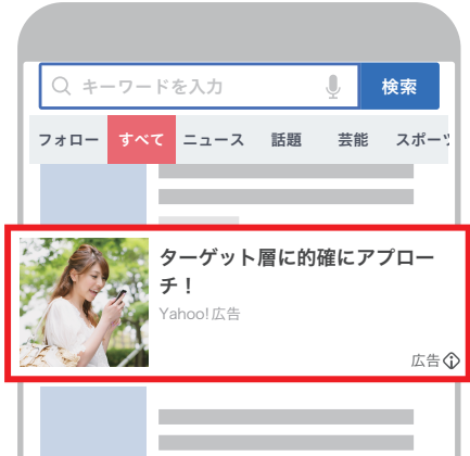
ディスプレイ広告 (運用型)

「検索広告」は商品やサービスを”今、探している”購買意欲の高いユーザーに広告を届けます。