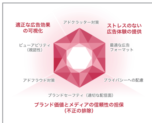
広告品質のダイヤモンドとは

広告品質のダイヤモンドでは、広告品質における3つの価値に基づき6つの対策に取り組んでいます。