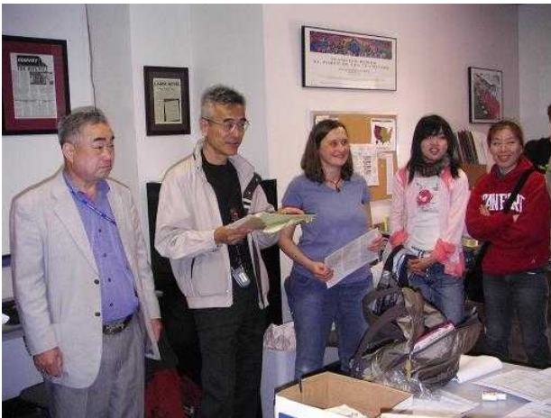
左から二人目が筆者

参加者は地域的には首都圏12人、静岡2人、愛知3人、兵庫1人、福岡1人と散らばり、年代的には退職者と団塊の世代が目立ちましたが、首都圏青年ユニオンの4人や若手の研究者3人も含まれ、多彩なメンバーとなりました。