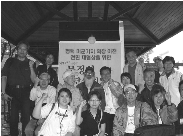
ピョンテク支援ハンスト（青瓦台）

先月5月4日、軍の正規兵と戦闘警察1万8千人で、超法規的に強制執行。重傷者多数。田植えを終えたばかりの水田は重機でめちゃくちゃ。以来、農民たちは毎夜キャンドル集会。ほとんど高齢のハルモニ、ハラボジ。集会後、支援者の宿泊所「平和の風」と呼ぶ、移転した条件派の家屋で交流。支援者は「おばあさんたちは、本当にただ田を耕したいだけだ。鉄条網で囲われてしまって、