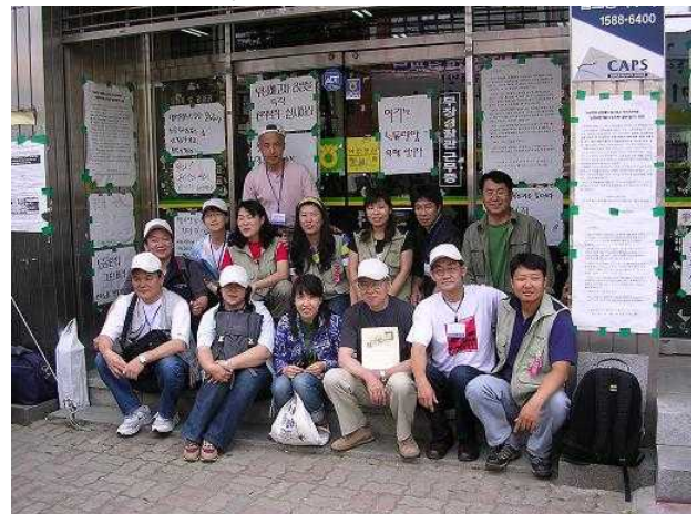
畜産協同組合での解雇箒城闘争850日(全羅北道イクサン市)

今回の日程の中で、全羅北道地域本部で金属連盟の役員に、フィリピントヨタ労組を支援する会機関紙と英文のILOへのアピール文書を渡すことができました。韓国ではトヨタ生産方式をJPSと称し、各産業に急速に浸透させ、日本財界人との頻繁な交流によって日本の労務管理、労働諸法の改悪を輸入しているそうです。日本での闘い如何がアジアに大きく影響していることは間違いありません。