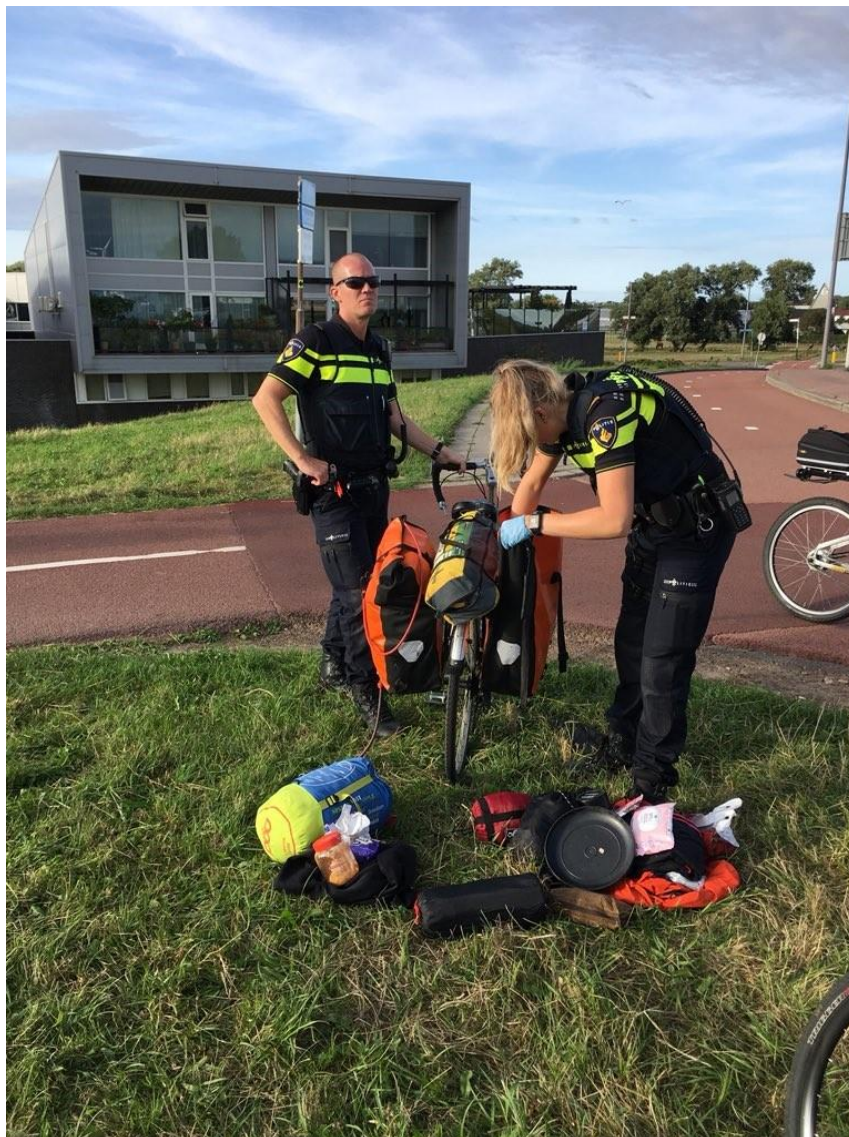
Doorzoeking van fietsen van betogers in Rotterdam op 21 augustus 2018

Als u na deze vormen van intimidatie nog steeds bereid bent om de straat op te gaan, wordt u bij een betoging aangesproken, zoals in het geval van 'Bob'. Er volgen geen normale beleefdheden en introductie. U moet actieplannen, namen en rugnummers overhandigen aan de staat. Ondertussen weet de politie en de inlichtingendiensten alles al van u. Als u al niet onderworpen wordt aan een verhoor tijdens een betoging, wordt u wel staande gehouden en moet u uw identiteitspapieren tonen. Gronden zijn niet meer nodig. Ook het doorzoeken van jassen en tassen zijn voor de overheid volstrekt normaal, want mensen die hun stem laten horen zijn per definitie niet te vertrouwen.