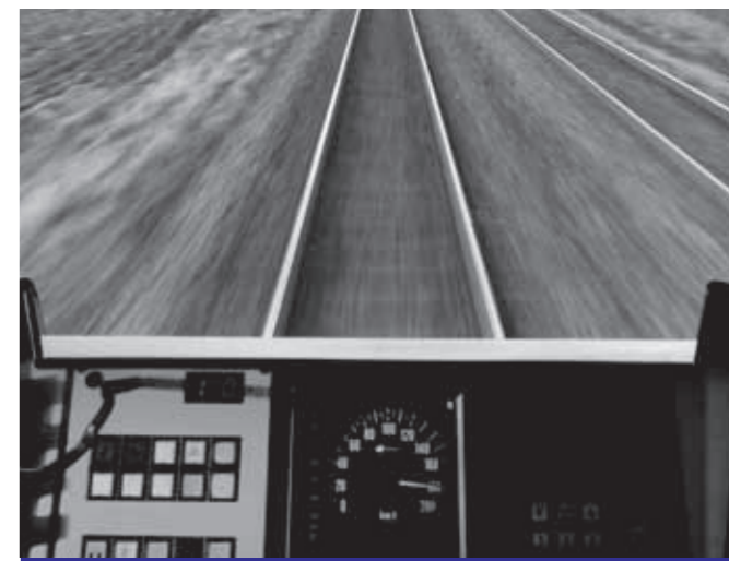
Tåg och självmord Läs mer på sid. 72

"OM VI VISSTE HUR VÅRA EGNA LIV HÄNGDE SAMMAN MED KVINNORS ALLMÄNNA VILLKOR SÅ SKULLE DET GÖRA OSS TILL BÄTTRE KÄMPAR FÖR ALLA KVINNORS SITUATION. VI ANSÅG DET NÖDVÄNDIGT ATT ALLA KVINNOR SÅG KVINNOKAMPEN SOM EN KAMP FÖR DEM SJÄLVA OCH INTE FÖR ATT HJÄLPA 'ANDRA KVINNOR.'" LÄS MER OM MEDVETANDEHÖJANDE BASGRUPPER PÅ S. 38.