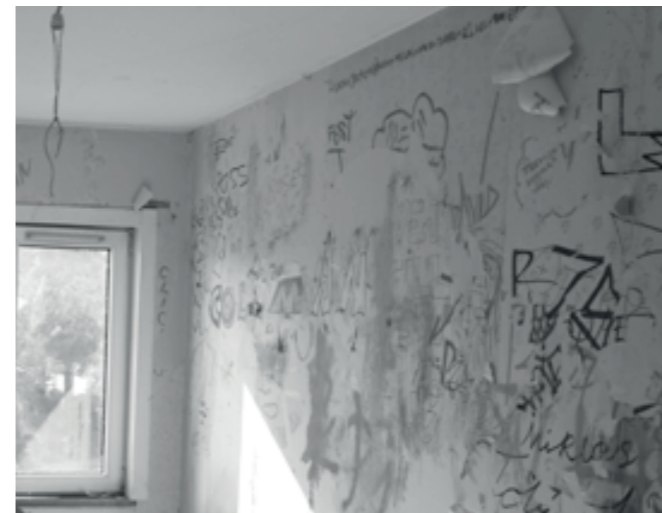
Konsten att skapa förändrade tillstånd Läs mer på sid. 34