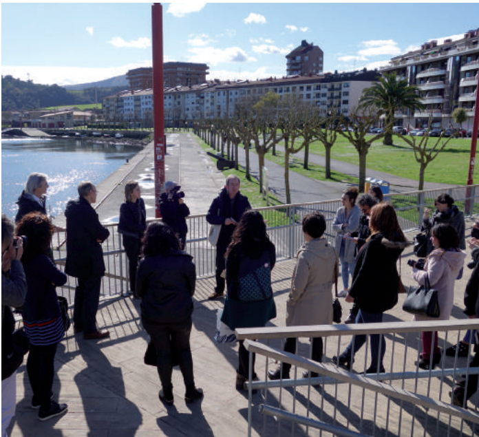
Kike Amonarriz soziolinguistak idatzi du bisita gidatuaren gidoia, Zumaiaiko Udaleko Euskara eta Turismo zerbitzuaren laguntzarekin. Argazkia: Baleike ( baleike.eus ).

'Enigma Bizia' izeneko bisita gidatua eskaintzen hasi dira Zumaian, bertako udaleko euskara eta turismo sailek antolatuta. Euskara herriko ondare garrantzitsua dela iritzita, euskara turismo eskaintzan nabarmendu dute, eta herrira heltzen diren turistei euskararen eta euskal kulturaren inguruko azalpenak emango dizkiete bisita gidatuan. UEMAk euskara eta turismoa uztartu nahian abiarazitako hausnarketarekin bat egiten duen ekimen aitzindaria da Zumaiaiko Udalarena.