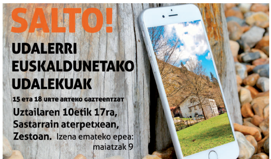
Udalerrri Euskaldunetako Gazteen Udalekuak iragartzeko UEMako kide diren herrietan zabaldutako kartela.

Proiektua bere osotasunean garatzeko, eta hezkuntza arautuaren mugak gainditu nahian, Salto! Gazte Topaketak antolatu zituen iaz lehen aldiz UEMak. 15 eta 18 urte arteko gazteak bildu ziren topaketa haietan, eta hiru egunetan hainbat ekimen eta ekitalditan hartu zuten parte. Egun haietan landutako eduki guztia modu lasaiagoan lantzeko eta gazte gehiagoren-