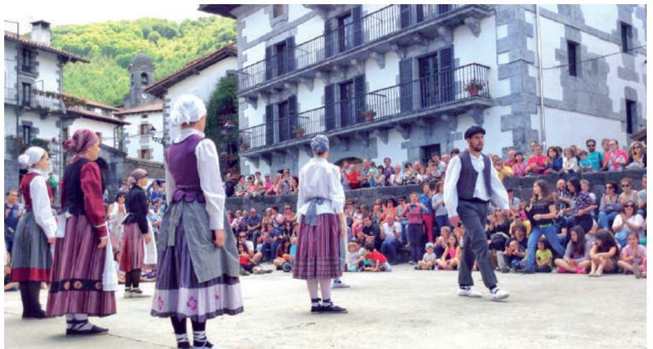
Udalerrri Euskaldunen Eguna Leitizan izan zen azken aldiz, 2016an. Batetik eta bestetik heldutako ehunka lagun elkartu zen egun osoan zehar, jaia eta aldarrikapena uztartzuz. Eguerdian, ekitaldi instituzionala ere izan zen (goiko argazkian).

arteko elkarlana bultzatzea izan ohi da Udalerrri Euskaldunen Egunaren asmoetako bat, hasieratik. Festa giroko ekitaldiez gain, beraz, izaten da ekitaldi instituzionalik ere.