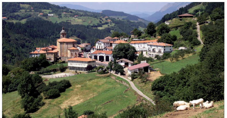
Errezilgo (argazkian) hirigintza planak herri osoan eragingo duela ondorioztatu dute, "euskararen ezagutzan jaitsiera aurreikusten baita HAPO bere osotasunean garatuz gero".

Hiri Antolamenduko Plan Orokorrak Herrian izango duen eragin linguistikoa neurtu dute Errezilgo eta Alegiako udalek, UEMArekin elkarlanean. Udalerrri euskaldunak berariaz zaintzeko beharra ikusita sortu zen Eragin Linguistikoaren Ebaluazioa, eta lege izaera hartu zuen 2016an, EAEko Udal Legea onartu zenean. Harrezkero, hirigintza planek edo gainerako proiektuek hizkuntzan izango luketen eragina aztertu beharra dute Gipuzkoako, Bizkaiko eta Arabako udalek. Egindako ebaluazioen ondorioetan, badaezpada neurri zuzentzaileak proposatu dituzte bi herrietan.