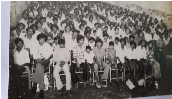
1970 களில் புரட்சிக் கம்யூனிஸ்ட் கழகத்தின் கூட்டம்

லங்கா சம சமாஜக் கட்சியின் காட்டிக் கொடுப்பு, வலதுசாரி சக்திகளுக்கு சகல வழிகளிலும் முட்டுக்கொடுத்து, புதிதாக உருவாக்கப்பட்ட புரட்சிக் கம்யூனிஸ்ட் கழகத்திற்கு பிரமாண்டமான சவால்களை உருவாக்கிவிட்டது.