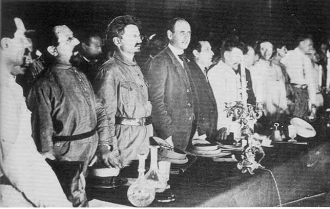
கம்யூனிச அகிலத்தின் முன்றாவது உலக மாநாட்டில் ட்ரொட்ஸ்கி (இடது பக்கத்தில் இருந்து முன்றாவது), 1921

புறநிலையை அகநிலையுடன் இயங்கியல்ரீதியாக ஐக்கியப்படுத்துவதற்கு மகத்தான மார்க்சிசப் பள்ளியில் நாம் கற்றிருக்கிறோம் என்றே நான் நம்புகிறேன். அதாவது, நமது நடவடிக்கைகளுக்கு அடித்தளமாக அகநிலை விருப்பின் இந்த அல்லது அந்த வெளிப்பாட்டை மட்டும் கொள்ளாமல், தொழிலாள வர்க்கம் நமது இந்த அகநிலை விருப்பிற்கு இணங்கக் கொண்டுவரப்பட வேண்டும் என்ற உறுதிப்பாட்டையும் அத்துடன் பாட்டாளி வர்க்கத்தின் நடவடிக்கைக்கான விருப்பானது புறநிலை சூழ்நிலையால் தீர்மானிக்கப்படுகிறது என்ற உறுதிப்பாட்டையும் கொண்டிருக்க வேண்டும் என்பதை நாம் கற்றிருக்கிறோம்.