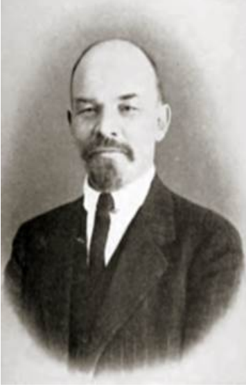
1916 இல் லெனின்

மட்டுமே சோசலிசத்தின் வெற்றிக்கு அவசியமான வலிமையையும் ஊக்கத்தையும் தர முடியும் என்ற உறுதியான நம்பிக்கையை லுனாசார்ஸ்கி அடிக்கடி வெளிப்படுத்துகிறார்.”[1]