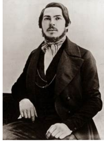
பிரடெரிக் ஏங்கெல்ஸ் அவரது இருபதுகளின் மத்தியில்

சடப்பொருளின் தர்க்கமல்ல, தர்க்கத்தின் சடப்பொருள் தான் மெய்யியல் கூறாகும். தர்க்கம் அரசை நிரூபணம் செய்வதற்காய் சேவை செய்யவில்லை, மாறாக அரசுதான் தர்க்கத்தை நிரூபிப்பதற்காய் சேவைசெய்கிறது.