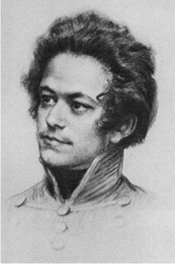
இளம் கார்ல் மார்க்ஸின் சமகாலத்தில் வரையப்பட்ட அவரது ஓவியம்

வேறு எந்தவொரு புரட்சியிலும் மார்க்சிசத் தத்துவத்திற்கும் தொழிலாள வர்க்கத்தின் புரட்சிகர நடைமுறைக்கும் இடையில் இத்தகையதொரு நனவான மற்றும் வெளிப்பட்ட உறவு இருந்தது கிடையாது. இந்த உறவின் தன்மையை இன்னும் துல்லியமாக விளக்கும் பொருட்டு, 2018 இல் நாம் அனுசரிக்கின்ற முக்கியமான வரலாற்று தினங்களை கவனத்தில் கொள்வது அவசியமாகிறது.