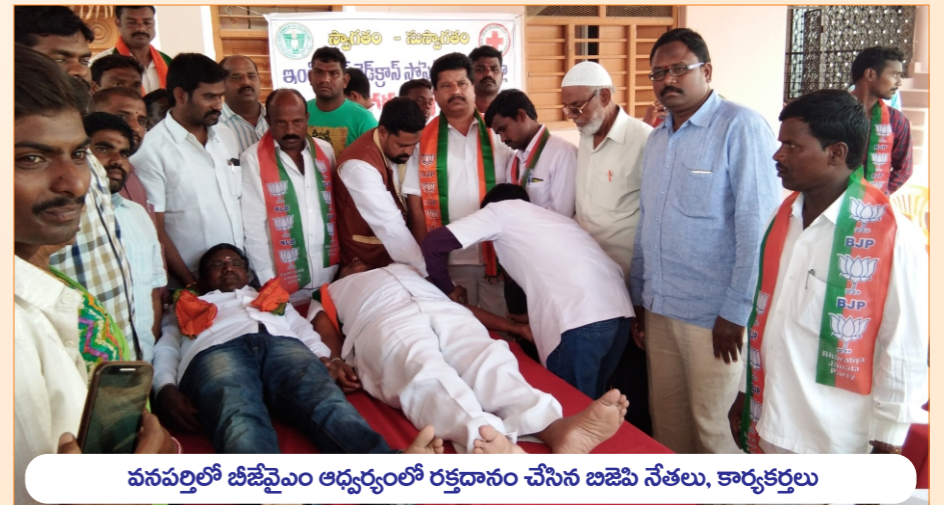
వనపర్తిలో బీజేవైఎం ఆధ్వర్యంలో రక్తదానం చేసిన బిజెపి నేతలు, కార్యకర్తలు