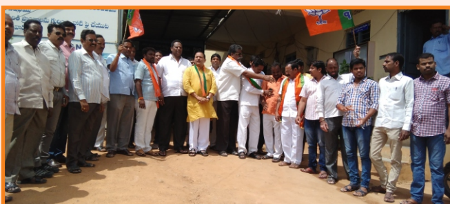
బడంగ్ పేట్ నగర పంచాయితీ పరిధిలో సమస్యలను పరిష్కరించాలని కోరుతూ బిజెపి నేతలు జూన్ 24న ధర్నా నిర్వహించారు. అనంతరం పంచాయితీ కమిషనర్ కు వినతి పత్రం సమర్పించారు.