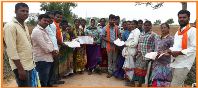
దిండి మండలంలో బీజేవైఎం కార్యవిస్తార యోజనలో భాగంగా ఇంటింటి ప్రచారం