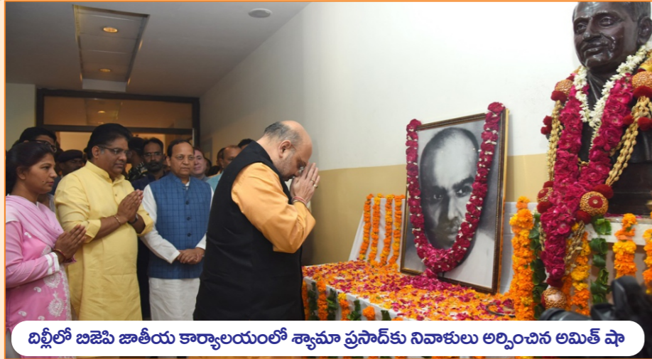
దిల్లీలో బిజెపి జాతీయ కార్యాలయంలో శ్యామా ప్రసాద్ కు నివాళులు అర్పించిన అమిత్ షా

జనసంఘ్ వ్యవస్థాపకుడు డా॥ శ్యామా ప్రసాద్ మఖర్జీ బలిదాన్ దివస్ పురస్కరించుకొని జూన్ 23న ఆ మహనీయుడికి బిజెపి నేతలు అనేక కార్యక్రమాల ద్వారా నివాళులు అర్పించారు. దిల్లీ నుంచి గల్లీ వరకు బిజెపి నేతలు శ్యామా ప్రసాద్ ను స్మరించుకున్నారు. కొందరు మొక్కలు నాటితే.. మరికొందరు పుస్తకాలు పంచిపెట్టారు. శ్యామా ప్రసాద్ ఆశయాలను నెరవేర్చేందుకు కృషి చేస్తామని ఈ సందర్భంగా బిజెపి నేతలు ప్రతిన బూనారు.