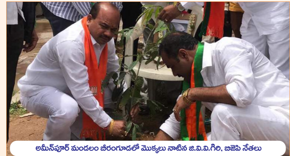
అమీన్ పూర్ మండలం బీరంగూడలో మొక్కలు నాటిన జి.వి.వి.గిరి, బిజెపి నేతలు