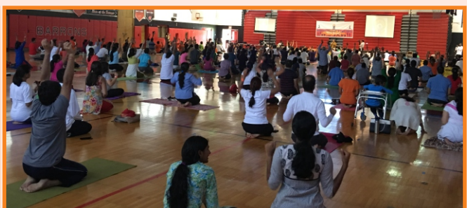
జూన్ 25న అంతర్జాతీయ యోగా దినోత్సవం పురస్కరించుకొని అమెరికా న్యూజెర్సీలో ఓవర్సీస్ ఫ్రెండ్స్ ఆఫ్ బిజెపి ఆధ్వర్యంలో యోగాసనాలు.