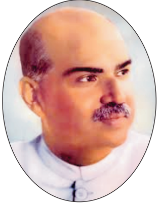
डॉ. श्यामा प्रसाद मुखर्जी