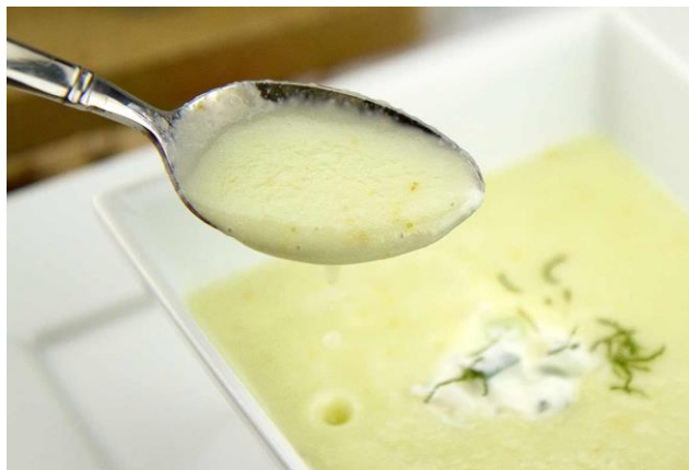
[Sopa de meló]

minimalisme perquè segons ell es basa en l'experiència de l'espectador en comptes de les qualitats relacionals de l'obra d'art. Per això segons Fried el minimalisme ofereix una experiència de teatralitat o "presència" en comptes d'estar "en el present". El crític Stephen Melville va contestar a Fried que la teatralitat és una característica ontològica de l'art que pot neutralitzar-se en certa mesura de forma temporal, però que no pot anul·lar-se mai del tot.