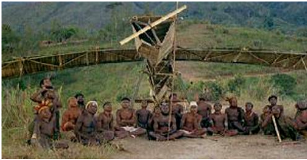
[Avui construït per les sectes Cargo]