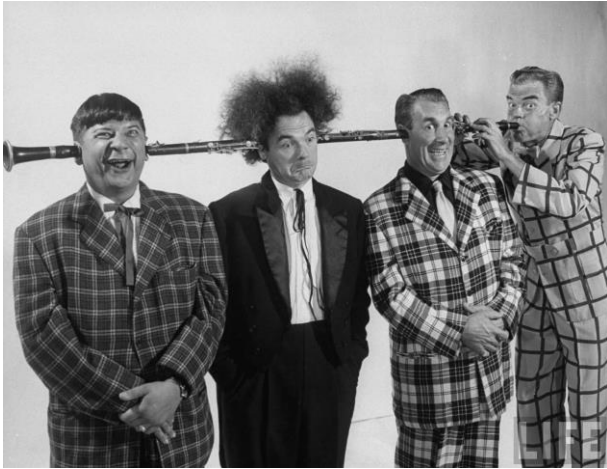
[Spike Jonze and his City Slickers]

La meva oïda em diu que aquest solo està tocat amb els dits.