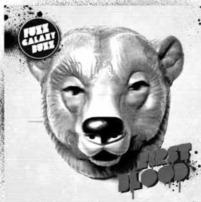
Fuzz Galaxy Buzz First Blood