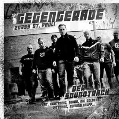
Gegengerade 20359 St. Pauli Soundtrack

Alles was Du brauchst unter: www.audiolith.net