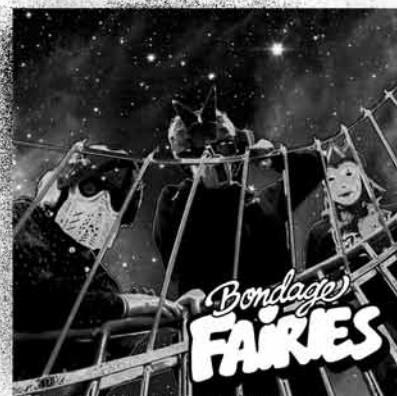
Bondage Fairies 1-0