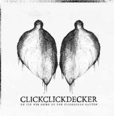
ClickClickDecker Du Ich Wir Beide Zu Den Fliegenden Bauten