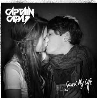
Captain Capa Saved My Life