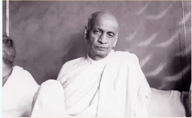
పటేల్ జయంతి సందర్భంగా అక్టోబర్ 31న బిజెపి ఆధ్వర్యంలో ప్రతి మండలంలో ‘ఐక్యతా పరుగు’

సర్దార్ వల్లభాయ్ పటేల్ పేరు మోసిన వకీలు. విదేశాల్లో