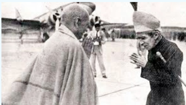
దుర్బలులైన వారు బలవంతులతో విరోధం పెంచుకోకూడదు. - విదురుడు