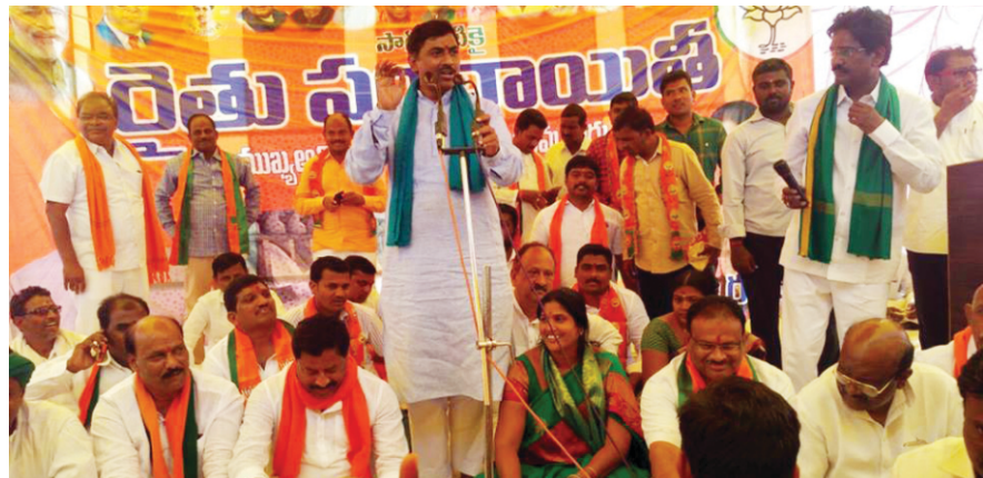
నాయకుడివి కావాలని తహతహలాడకు, సేవకుడివయ్యేందుకు తపించు. - స్వామి వివేకానంద