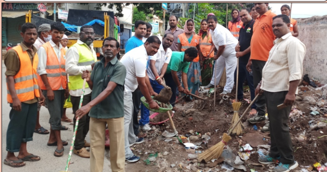
జూబ్లీహిల్స్ అసెంబ్లీ నియోజకవర్గం యూసుఫ్ గూడ డివిజన్ లో స్వచ్ఛభారత్ లో పాల్గొన్న బిజెపి నేతలు