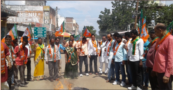
కేరళలో 120 మంది బిజెపి కార్యకర్తలను హత్య చేసినందుకు నిరసనగా అక్టోబర్ 11న సీపీఎం పార్టీ దిష్టిదొమ్ము దహనం చేసిన మహబూబాబాద్ జిల్లా బిజెపి నాయకులు