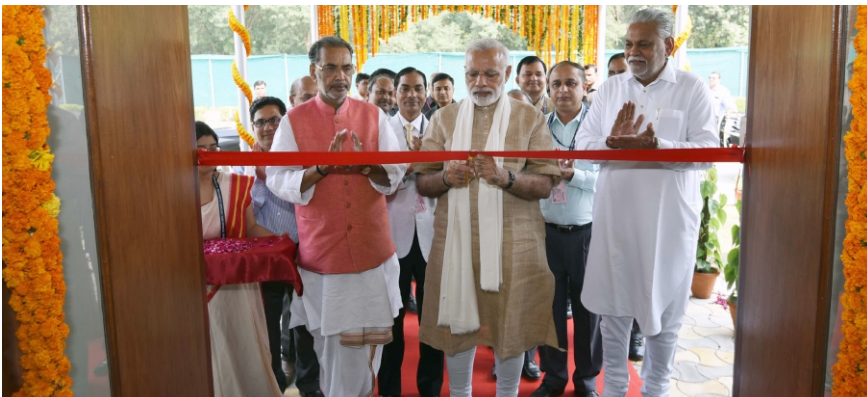
దుర్బులైన వారు బలవంతులతో విరోధం పెంచుకోకూడదు. - విదురుడు