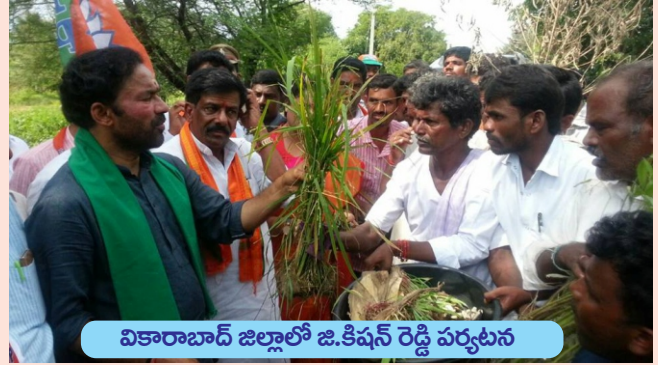
వికారాబాద్ జిల్లాలో జి.కిషన్ రెడ్డి పర్యటన

రైతు భరోసా పర్యటనలో భాగంగా బిజెపి శాసనసభా పక్షనేత జి.కిషన్ రెడ్డి నేతృత్వంలో బిజెపి బృందం అక్టోబర్ 14న వికారాబాద్ జిల్లాలో పర్యటించింది. ఇందులో భాగంగా కుల్చుచర్ల మండలం అంతారం, ఇప్పాయిపల్లి, దోమ మండలం ఐనాపూర్, మల్లేపల్లి, దాదాపురం గ్రామాల్లో దెబ్బతిన్న పంటను సందర్శించారు. స్వయంగా రైతులతో మాట్లాడి పరిస్థితిని తెలుసుకున్నారు. భారీ వర్షాలకు పంటలను నష్టపోయిన రైతులను రాష్ట్ర ప్రభుత్వం వెంటనే ఆదుకోవాలని డిమాండ్ చేశారు. అకాల వర్షాల కారణంగా చాలామంది రైతులు తీవ్రంగా నష్టపోయారని వాపోయారు. రెండు, మూడు రోజుల్లో చేతికి అందునున్న పంటలు పూర్తిగా పాడవడంతో అన్నదాతలు దిక్కుతోచని స్థితిలో ఉన్నారని ఆందోళన వ్యక్తం చేశారు. నష్టాన్ని అంచనా వేసి, రైతులకు భరోసా ఇవ్వడంలో రాష్ట్ర ప్రభుత్వం విఫలమైందని విమర్శించారు. పంటలకు జరిగిన నష్టాన్ని పరిశీలించారు. వర్షాల కారణంగా చిన్న, సన్నకారు రైతులు ఆవేదనలో ఉన్నారని, వేసిన పంటల కోసం చేసిన అప్పులను ఎలా తీర్చాలో తెలియని పరిస్థితిలో ఉన్నారన్నారు. కేంద్ర ప్రభుత్వం రైతులను ఆదుకోవడానికి ఫసల్ బీమా పథకాన్ని ప్రవేశ పెట్టినా... రాష్ట్ర ప్రభుత్వ నిర్లక్ష్యం కారణంగా అన్నదాతల దరికి చేరడం లేదని ఆరోపించారు. అంతేకాకుండా కేంద్ర ప్రభుత్వమే ప్రతి గ్రామానికి రోడ్డు సౌకర్యం కల్పిస్తున్నా రాష్ట్ర ప్రభుత్వం తామే వేయించామని చెప్పడం దారుణమని