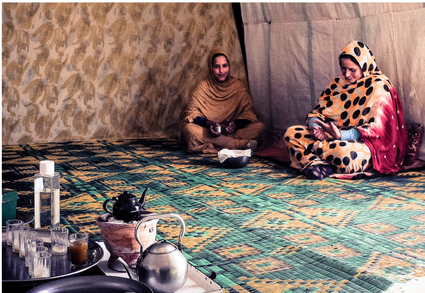
For første gang har en spesialutsending for Vest-Sahara vært på besøk i Vest-Sahara. Det fikk ikke disse to kvinnene være vitne til.