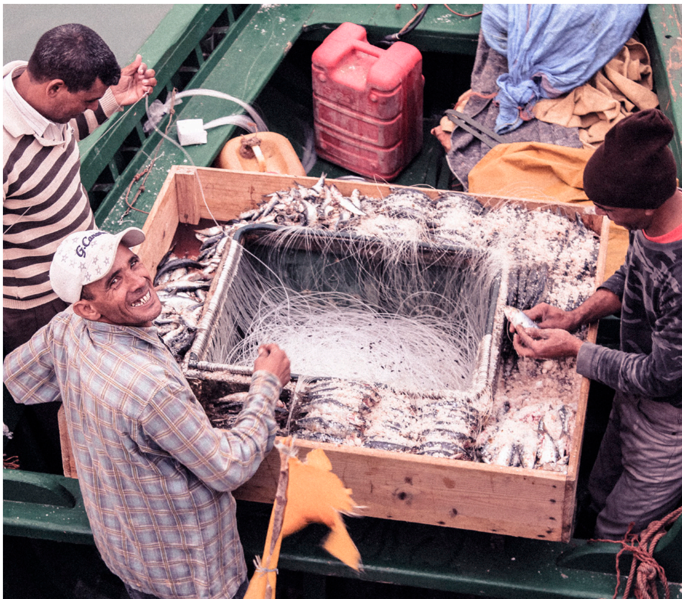
Flertallet av fiskerne i okkuperte Vest-Sahara er marokkanere. Bakgrunnen til disse mennene er ukjent.