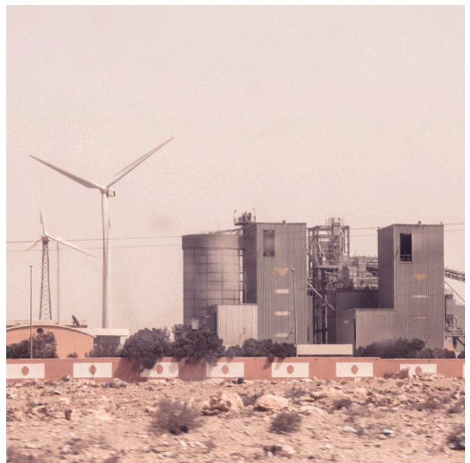
Denne bedriften i okkuperte Vest-Sahara vil ha FN-støtte for vindmøllene sine.

Det er 70 norske medlemmer av Global Compact. Blant dem tre selskaper som de siste årene har importert varer fra marokkanske selskaper i Vest-Sahara for flere hundre millioner kroner, samt et selskap som har solgt krigsmateriell til Marokko.