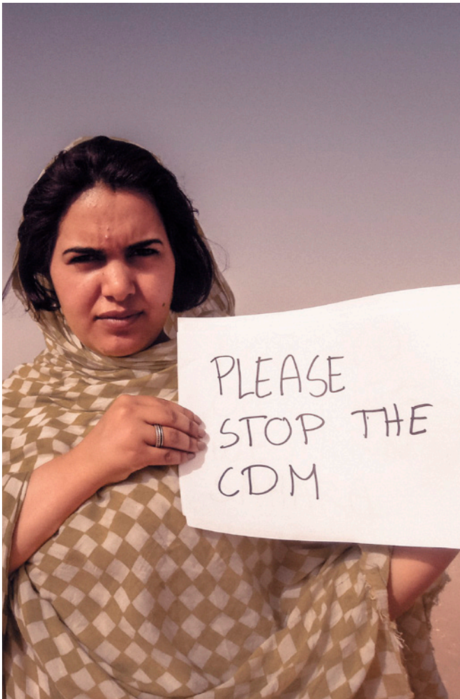
Saharawisk flyktningkvinne ber om at FN ikke skal legge til rette for å finansiere næringslivsprosjekter i de okkuperte områdene.