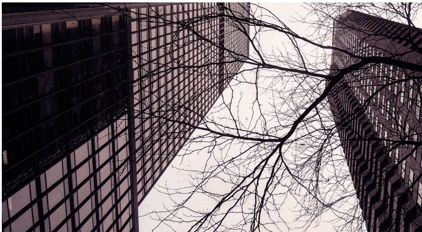
Bygningen til venstre huser Frankrikes delegasjon til FN. Frankrike er Marokkos nærmeste allierte, og legger føringene for framtiden til Vest-Saharas folk.