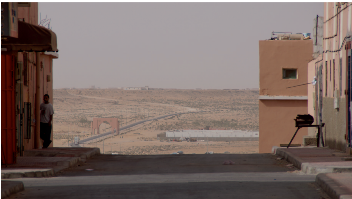
Fra utkantene av Laayoune kan man speide utover ørkenen.