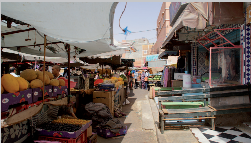
Fargerike frukter på markedet i Laayoune