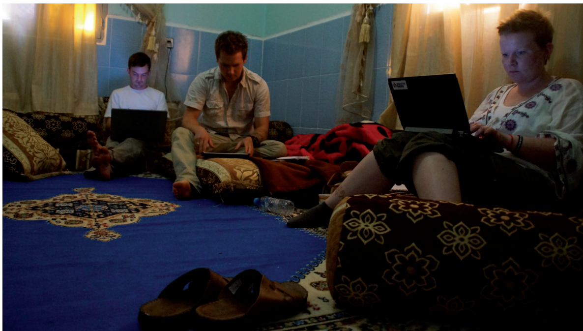
Ledige stunder ble brukt til å overføre notatene til PC, skriftlige notater destruerte vi snarest mulig.

Etter maten hadde vi møte med organisasjonen som kjemper for rettighetene til saharawiene i Boujdour. Byen er strategisk viktig fordi den er en havneby med mye blekksprut og fisk langs kysten. I dag er det marokkanerne som ulovlig utnytter ressursene havet gir. Videreforedlingen av fisken skjer gjerne i Marokko og sluttproduktet merkes som marokkansk. Norge var på et tidspunkt sannsynligvis en av verdens største importører av ulovlig fiskeolje fra Vest-Sahara. Det har også vært et kraftig overfiske slik at flere av artene trues av utryddelse. Saharawiene sitter igjen med en hverdag der de utsettes for grove menneskerettighetsbrudd og ikke får jobb i sitt eget land, mens Marokko tjener store penger på naturressursene i Vest-Sahara. Det ekstra triste er at internasjonale selskaper slett ikke fornekter seg for å ta del i ranet!