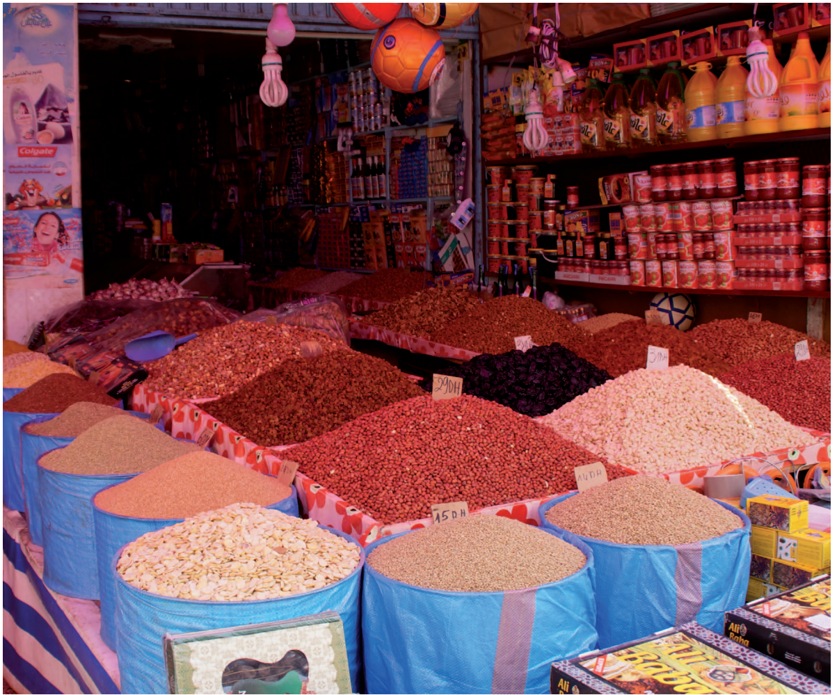
Eksotiske krydder på markedet i Laayoune