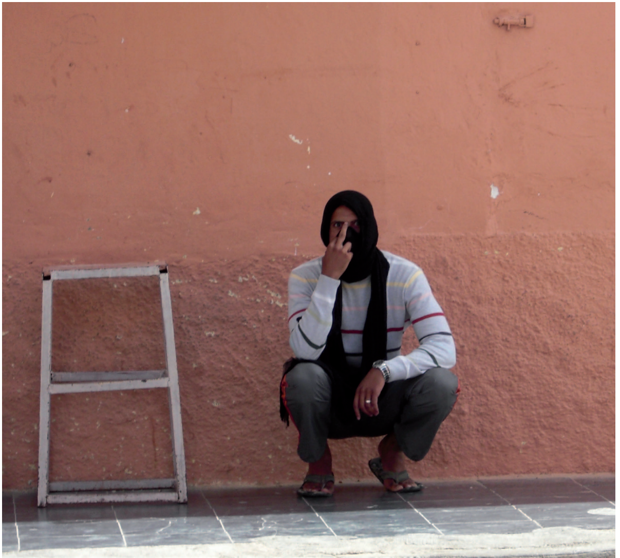
Ikke alle sivilspanerne var like glad i å bli fotografert.

Førsteintrykket når du ankommer Laayoune levner deg ingen tvil om at du er i okkupert område. Det er marokkanske flagg over alt, og på gaten er det hengt opp store bilder av kongen av Marokko. Selv tenkte jeg umiddelbart at det måtte være litt sånn det føltes å komme til byer som Tyskland okkuperte under andre verdenskrig - vertfall hva symbolikk gjelder. Det er uniformert politi på hvert gatehjørne og man ser også mange politibiler med gitter foran vinduene som blir brukt til å slå knallhardt ned på den minste form for demonstrasjoner.