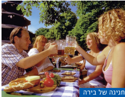
חגיגה של בירה