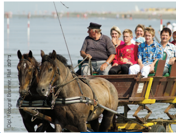
טיולים לכל המשפחה