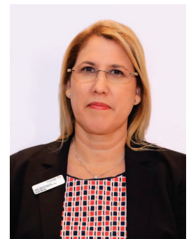
אפשרויות נפלאות. מולר

מרחבי הטבע הנדירים, התרבות, המוזיקה, הערים התוססות, האוכל המשופה, מרכזי הקניות העשירים, המסורת המרתקת, הטכנולוגיה החדשנית ואינספור אפשרויות הנופש המגוונות, הופכות את גרמניה ליעד תיירותי אהוב במיוחד על התייר הישראלי.