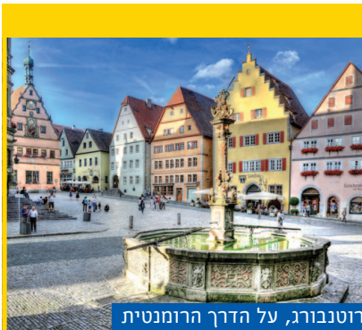
רוטנבורג, על הדרך הרומנטית

אתר התיירות של גרמניה: germany.travel/en