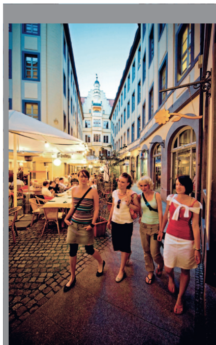
צילום: Brzoska, Leipzig Tourismus

Germany.travel gogermany.about.com/od/shopping