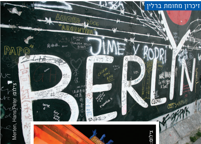
זיכרון מחומת ברלין