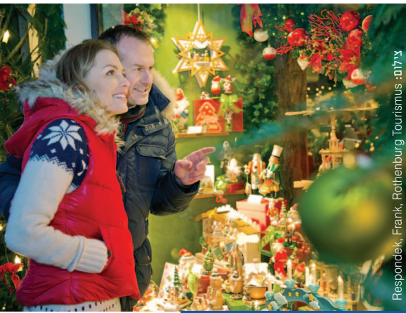
השווקים הצבעוניים של חג המולד