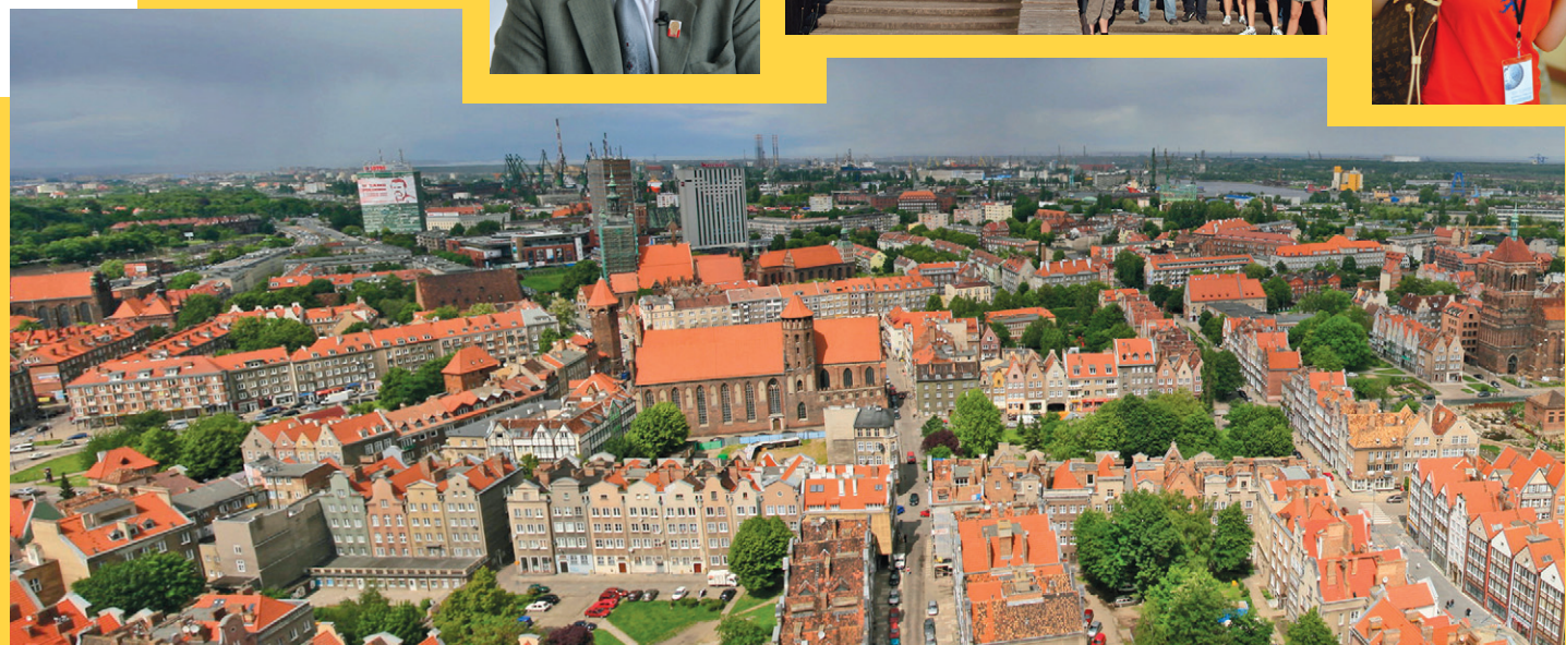
Michał Stupczewski (www.slupczewski.pl), CC BY SA 3.0