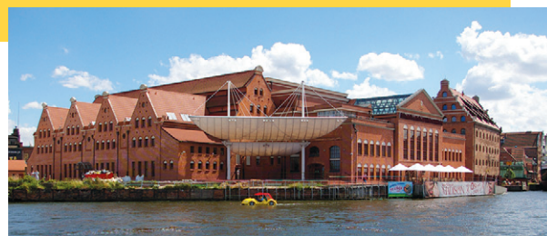
Lukasz Golowanow, CC BY SA 3.0